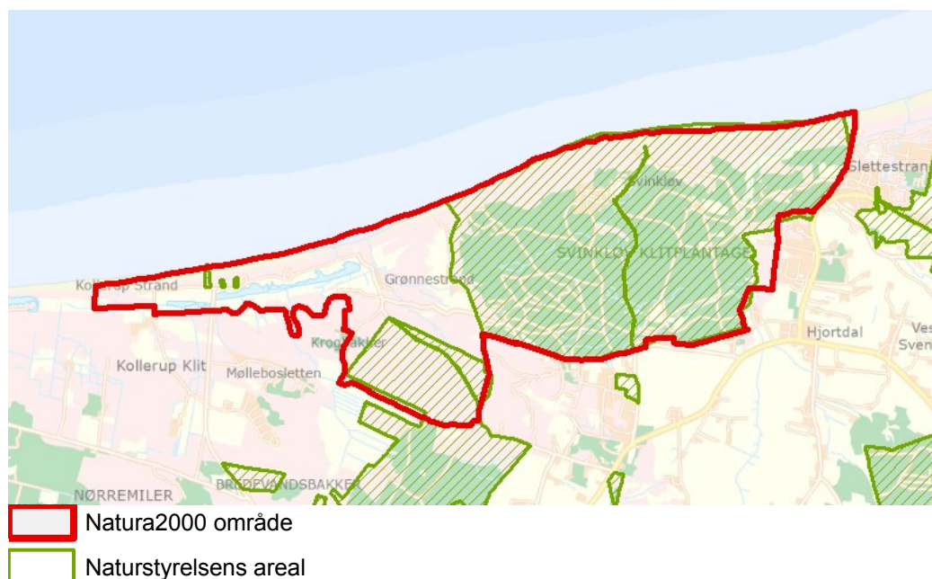
Figur 1: Oversigtskort over Natura 2000-områdets afgrænsning

I denne plejeplan er arealer og indsatser opdelt på henholdsvis lysåbne naturtyper og arter knyttet til de lysåbne naturtyper. Natura 2000 plejeplaner for de skovbevoksede naturtyper, samt mere detaljerede oplysninger om indsatsen i Natura 2000-områderne findes på Naturstyrelsens hjemmeside vedr. Natura 2000. Bemærk, at Naturstyrelsens samlede arealforvaltning i området er omfattet af flere planbestemmelser og retningslinjer end dem, der findes i denne plan. For supplerende læsning herom henvises til Naturstyrelsens driftsplaner for det pågældende område, som findes på Naturstyrelsens hjemmeside vedr. driftsplanlægning.