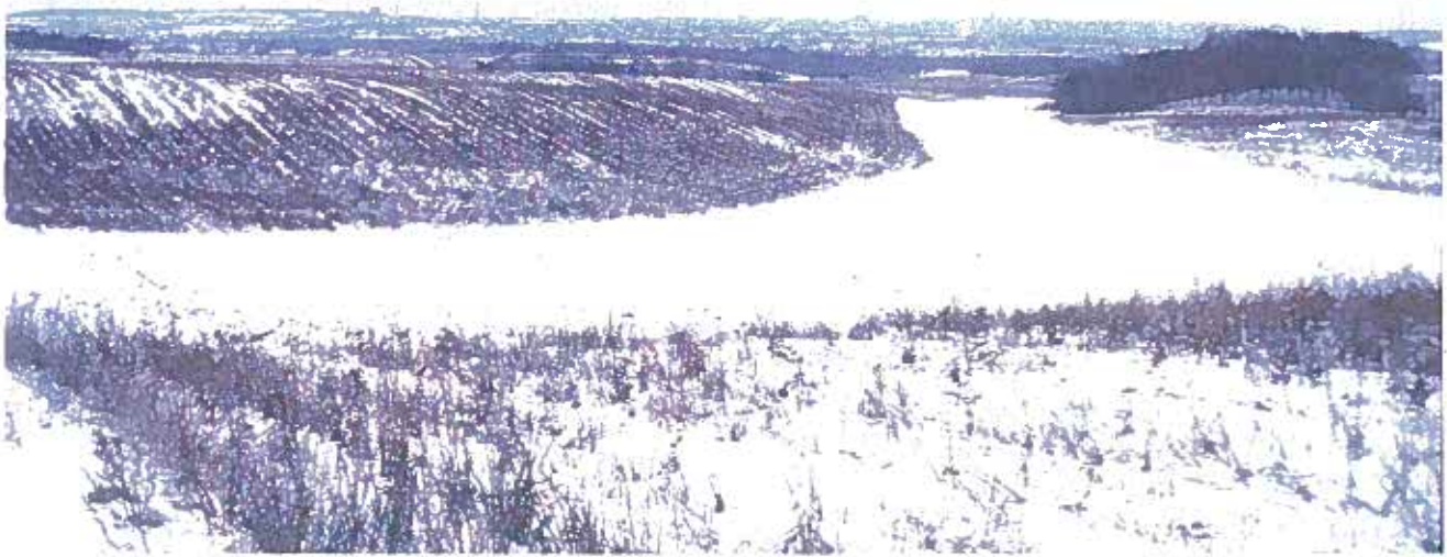
Eksempel på indtænkning af skovrejsningen i landskabet. Bakkerne er tilplantet så erosionsdalen fremtræder tydeligere. Drastrup Skov ved Aalborg.