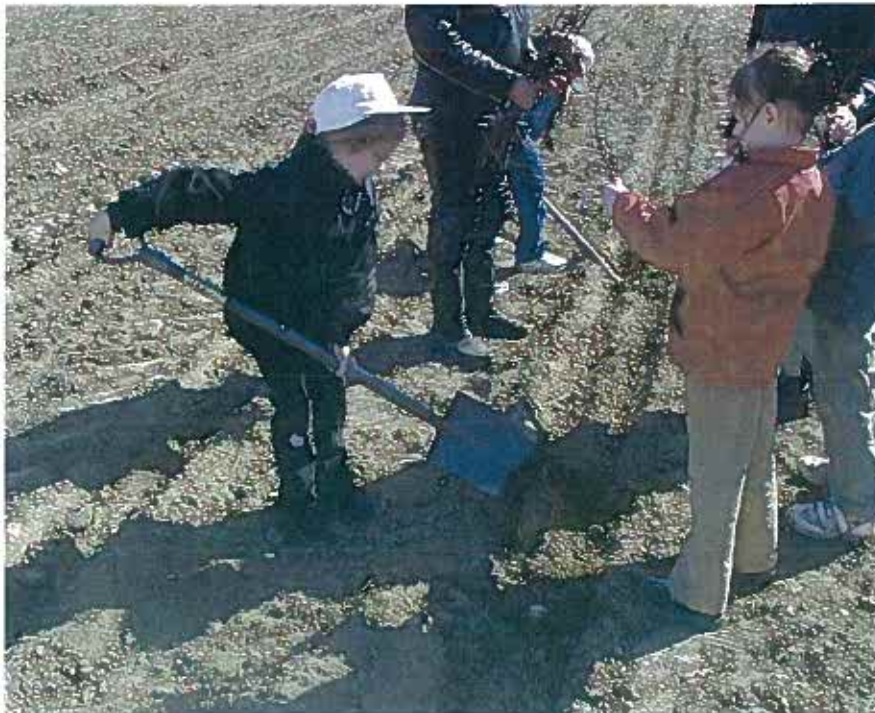
Børn der planter ny skov. Elmelund Skov ved Odense.