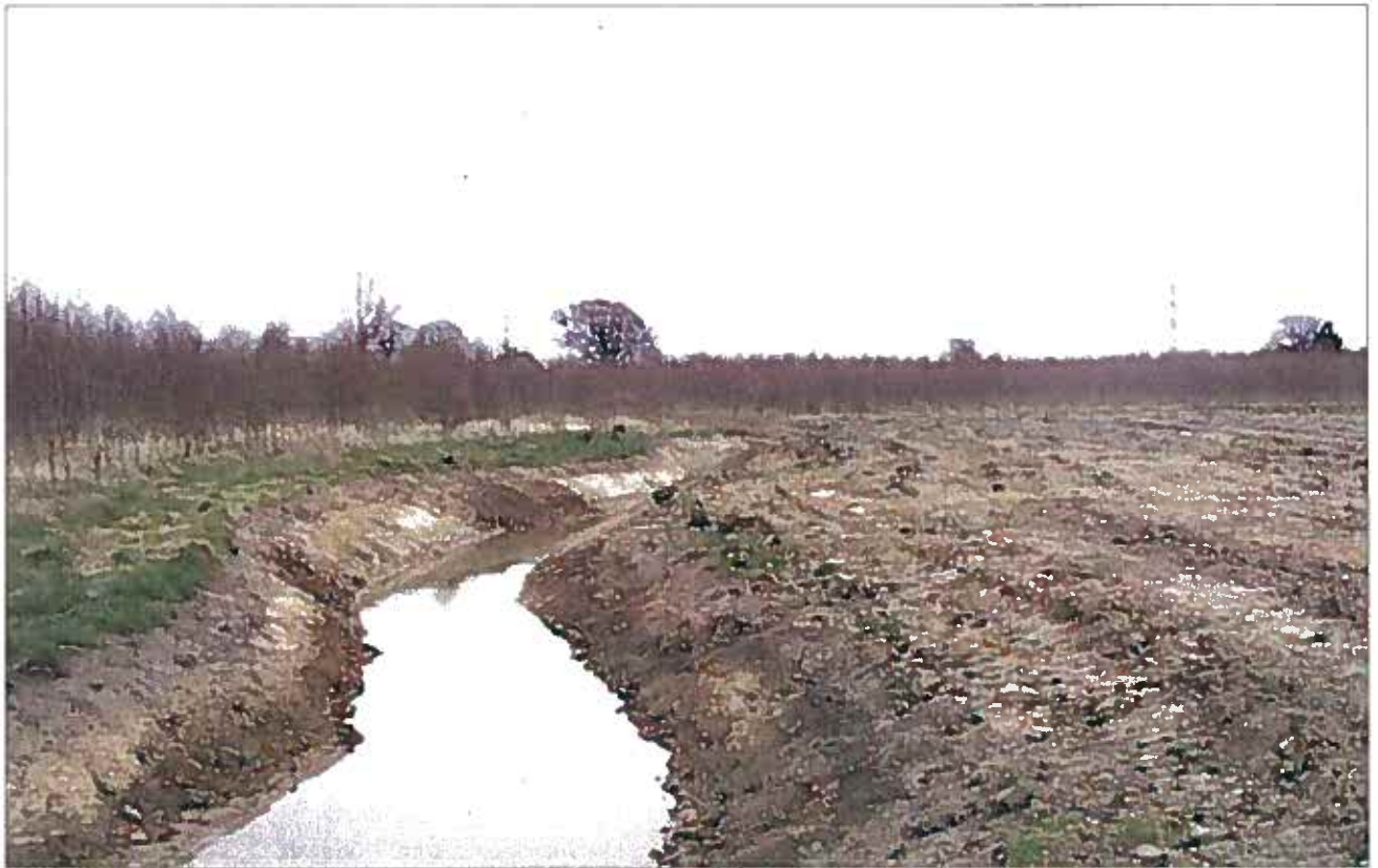
Naturgenopretning af rørlagt vandløb. True Skov ved Århus.