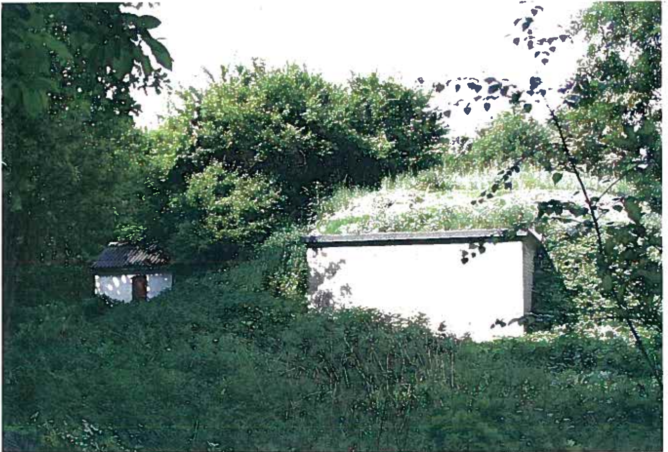
Vandværk i skov.