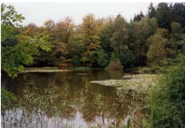
Elverdammen ved Søholt

Fra Holmsbakkevej går ruten mod nord ad en skovsti gennem en bevoksning af bøg. Øst for vejen ses et lille område, der allerede har været urørt i mange år. Det ses på de døde og døende træer med mange spættehuller og svampe. Om 100 år vil den nye naturskov, måske ligne dette lille skovstykke. Turen kan nu afsluttes ved enten at gå gennem den dyrkede skov til p-pladsen eller fortsætte tilbage til Elverdam.