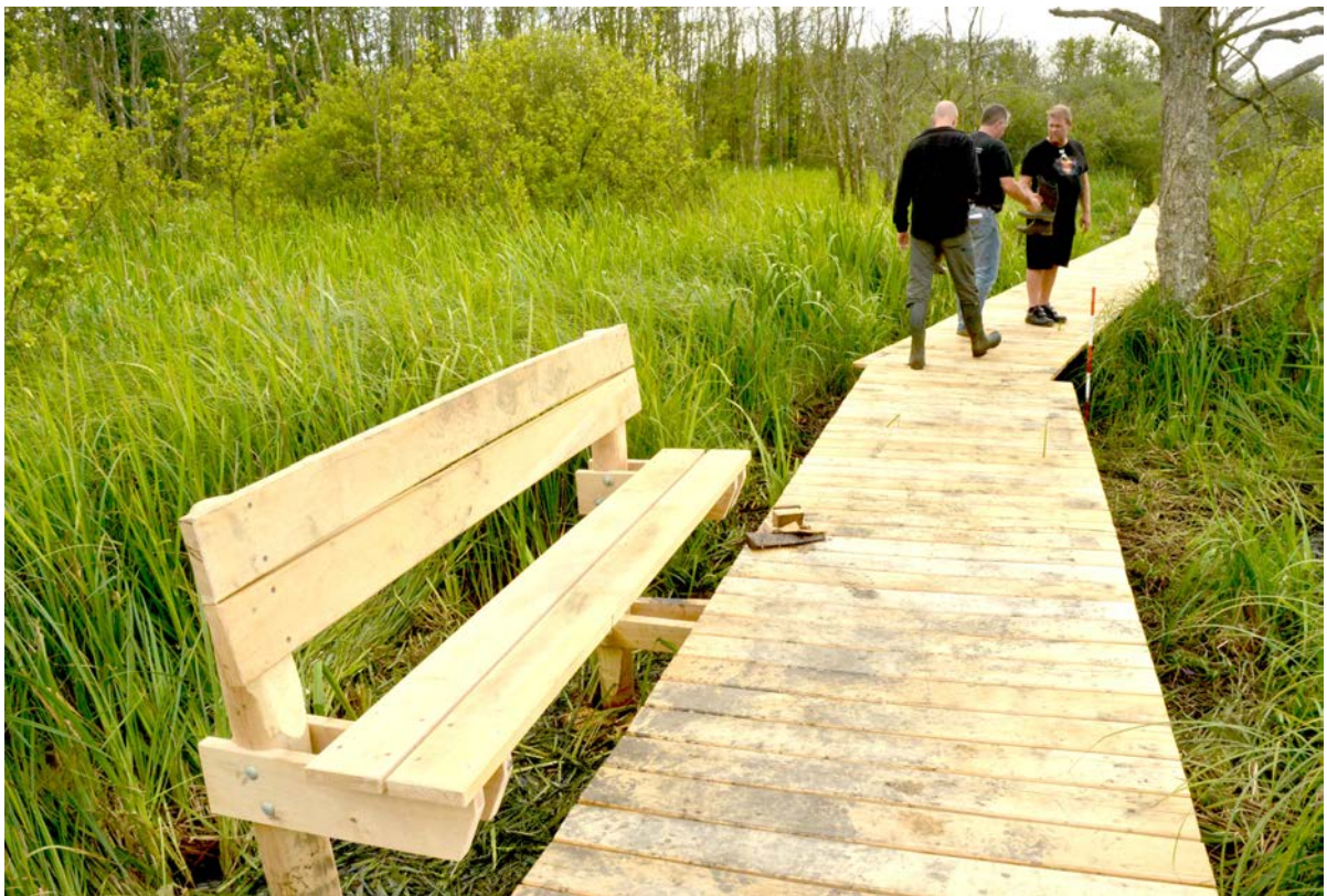
Fra anlæggelsen af træstier i Vejerslev Skov