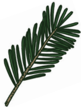
Nord- manns- gran