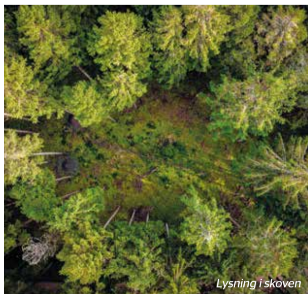
Lysning i skoven

Klosterheden bestod en gang af to områder; Kronheden, som ligger vest for Flynder Å, var ejet af Kongehuset og Klosterheden øst for Flynder Å, tilhørte Gudumkloster, som var en del af Benediktinerordenen. Efter reformationen i 1536 overtog Kongehuset klosteret og dets jorde, men tilplantningen af området begyndte først omkring 1874. De efterfølgende årtier opkøbte staten både større og mindre områder og begyndte den egentlige tilplantning, som i år 1900 resulterede i, at Klosterheden blev udpeget til et selvstændigt skovdistrikt.