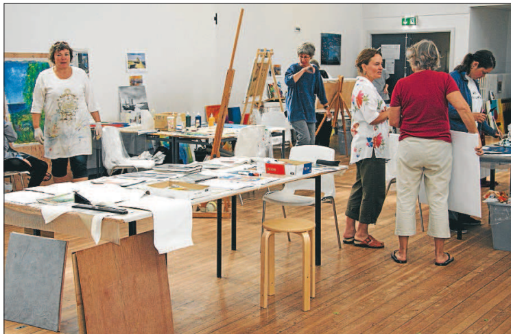
Læsø Sommerskole er en af de private foreninger, der gennem flere år har fået dispensation til at låne skolens samlingssal til kurser.

sen konstaterede, at der stort set var enighed i kommunalbestyrelsen - bortset fra formuleringen, som skal præciseres i social og kulturudvalget.