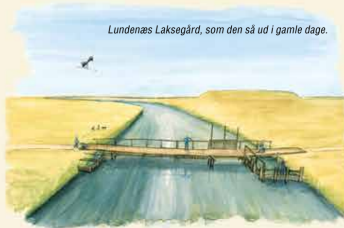
Lundenæs Laksegård, som den så ud i gamle dage.

I ældre tider var det vanskeligt at passere åen og de våde enge. Den nuværende Kong Hans Bro er bygget nær det sted, hvor den ældste af flere broer over Skjern Å lå. For Kong Hans blev stedet skæbnesvangert. Han døde kort efter et fald fra sin hest, da han var på vej over den tilfrosne ådal i 1513.