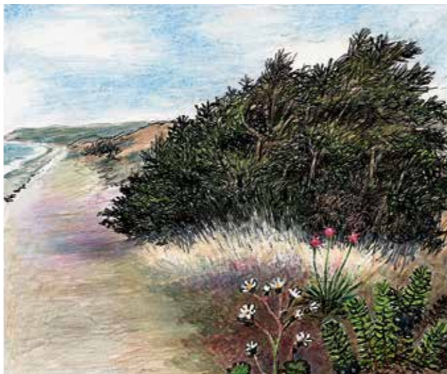
Fortroptræ med engelsk græs, kornet stenbræk og revling i forgrunden

Under 2. verdenskrig var kysten her et vigtigt udskibningssted. Det var Frihedsrådets såkaldte Nordrute for jøder på flugt til Sverige. Fiskere fra Odden havn havde det farefulde hverv at sejle jøderne til Sverige, og kutterne skulle være hjemme inden det blev morgen og før tyskerne anede uråd.