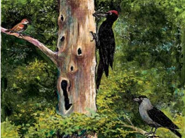
Bogfinke, sortspætte og allike