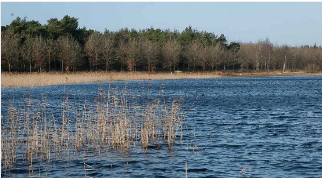
Udsigt over Skørsø.

Dette Natura 2000-område er specielt udpeget på grundlag af en væsentlig tilstedeværelse af naturtypen Lobeliesø samt arten odder . Natura 2000-planens målsætninger og indsatsprogram er væsentlige elementer i beskyttelsen af disse og af en generel sikring og forbedring af områdets naturværdier.