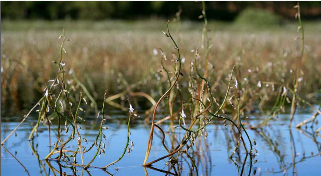
Tvepibet lobelie er karakteristisk for naturtypen lobeliesø og er afhængig af rent og klart vand.

De konkrete målsætninger fastlægger de langsigtede mål for udvikling i areal og tilstand for de enkelte naturtyper og arters levesteder. De konkrete mål tager udgangspunkt i den tilstand, som er vurderet for naturtyper og arters levesteder efter tilstandsvurderingssystemet. Hvor der ikke er udviklet et sådant system skal gunstig bevaringsstatus sikres eller genoprettes på baggrund af den bedste faglige viden.