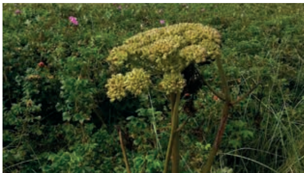
Skotsk Lostilk – én af de plantearter hvis voksested, især i Thy, trues af rynket rose.

Klitområde uden rynket rose er levested for mange plante- og dyrearter >>.