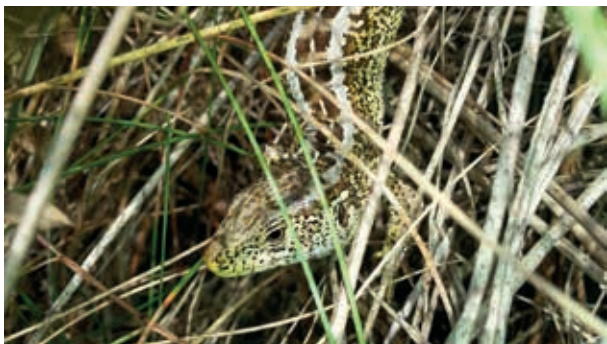
Markfirben – én af de dyrearter hvis ynglested trues af rynket rose.