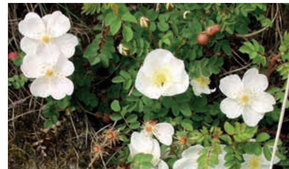
Klitrose hører til i den danske natur og får sorte hyben.