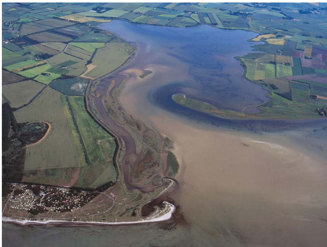
Billede 2 Nærá Strand, set fra nord. Vadehavslignende forhold, krumoddedannelser og inddæmmede fjordområder.

For en uddybende beskrivelse af Natura 2000-området, herunder præsentation af udpegningsgrundlaget for området, henvises til Natura 2000-planen . På Naturstyrelsens hjemmeside kan der også findes forklaring af begreber mv.