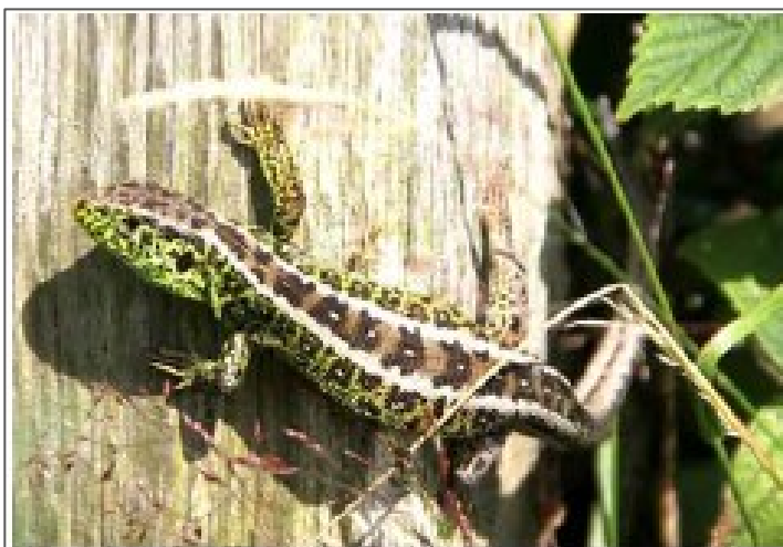
Billede 2: Hanmarkfirben i yngledragt

Ynglesæsonen strækker sig fra april til juli, og markfirbenet bliver kønsmodent efter 2. eller 3. overvintring. I ynglesæsonen får hannerne tydeligt grønne flanker. Hunnen lægger i sjældne tilfælde to kuld på én ynglesæson, men som regel kun ét. Et kuld består af 4-15 æg alt afhængigt af hunnens alder og størrelse, samt hvor gunstigt vejret og lokaliteten er. Æggene lægger hunnen i et 4-10 cm dybt hul, hun har gravet i en soleksponeret, løs, veldrænet jord, hvorefter hun dækker hullet til. Efter 45-90 dage er æggene modnet.