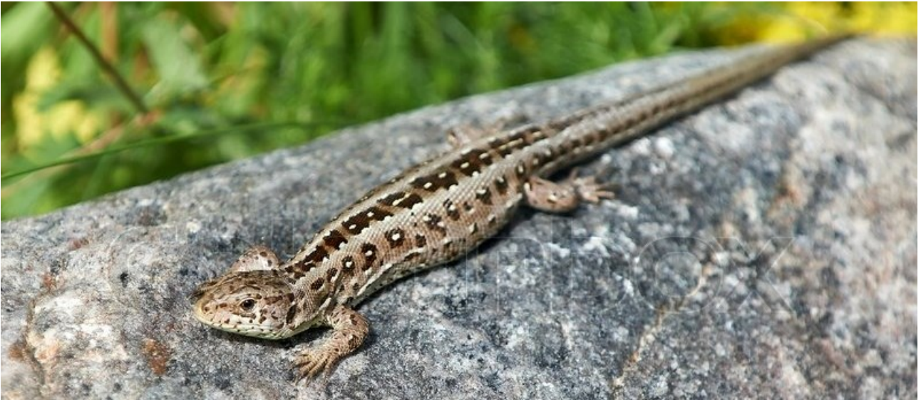
Billede 1: Markfirben

For Danmarks største øgle, markfirbenet, udgør de solbeskinnede skråninger langs Fodsporet perfekte levesteder. Her kan den nemlig optage varme fra solens stråler, og hunnen kan lægge sine æg. Det er dog ikke helt nemt at være markfirben i Danmark for tiden, for mange af dets levesteder er ved at gro til med høje urter, græsser, buske og træer, som skygger for de varme solstråler.