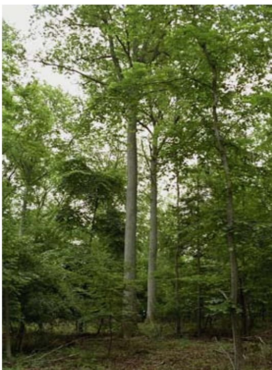
Frøtræ i F.148