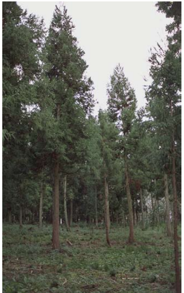
Der indsamles frø i en del af bevoksningen, som er tyndet meget kraftigt og senere underplantet.

Det årlige frøbehov i Danmark er meget begrænset. Frøet samles i oktober-november måned. Frøkilden vil rigeligt kunne dække efterspørgslen, og i praksis samles der kun i en begrænset del af bevoksningen. Henvendelse til Statsskovenes Planteavlstation, telefon: 49 19 02 14.