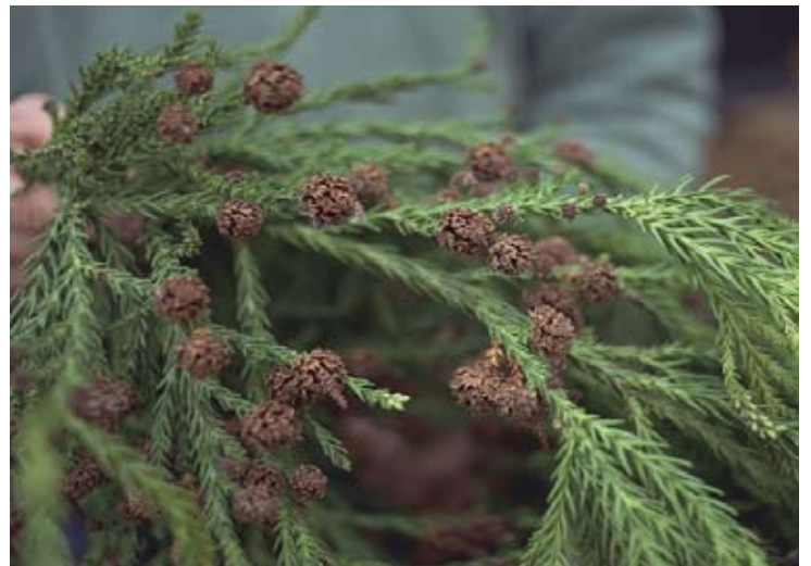
Gren med kogler.