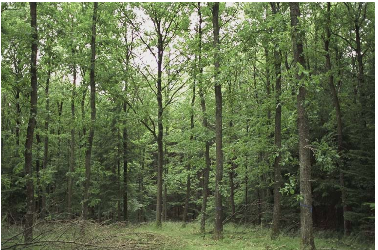
Bevoksningen fotograferet i foråret 2000.

Drift af bevoksningen: Den kårede bevoksning har været meget svagt tyndet. Der er i vinteren 1999/2000 foretaget en lidt kraftigere udhugning. Der er valgt 10 plustræer i bevoksningen som led i forædlingsprogrammet for vintereg.