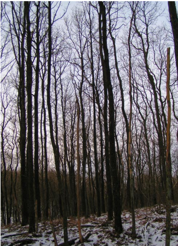
Bevoksningen i vintertilstand.