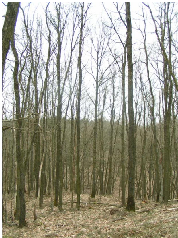
F.756 Kollemorten Krat.

Produktion: Produktionen er ukendt; men svarer formentlig til anden jysk vinterreg. Under udsatte forhold på heden er jysk vinterreg ofte mere vækstkraftig end stilkeg.