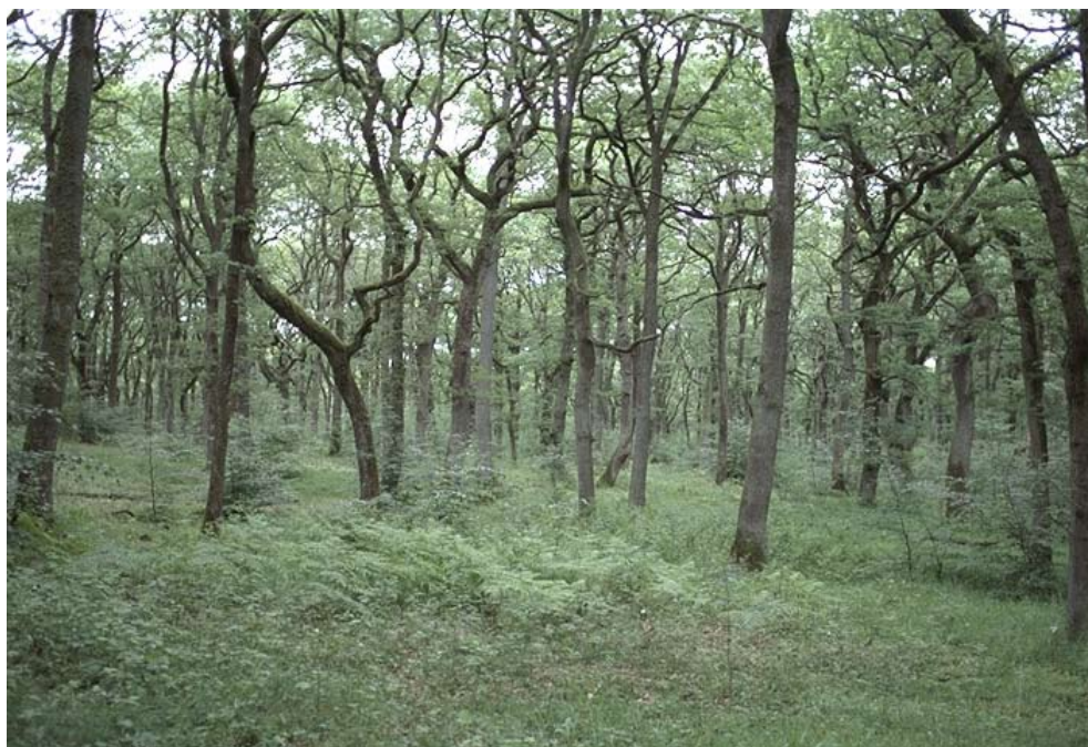
Foto 2. Bevoksning i Hald Ege er som så mange andre egekrat præget af stævningdriften.

F.815 ligger rundt om Hald Ege, syd for Viborg.