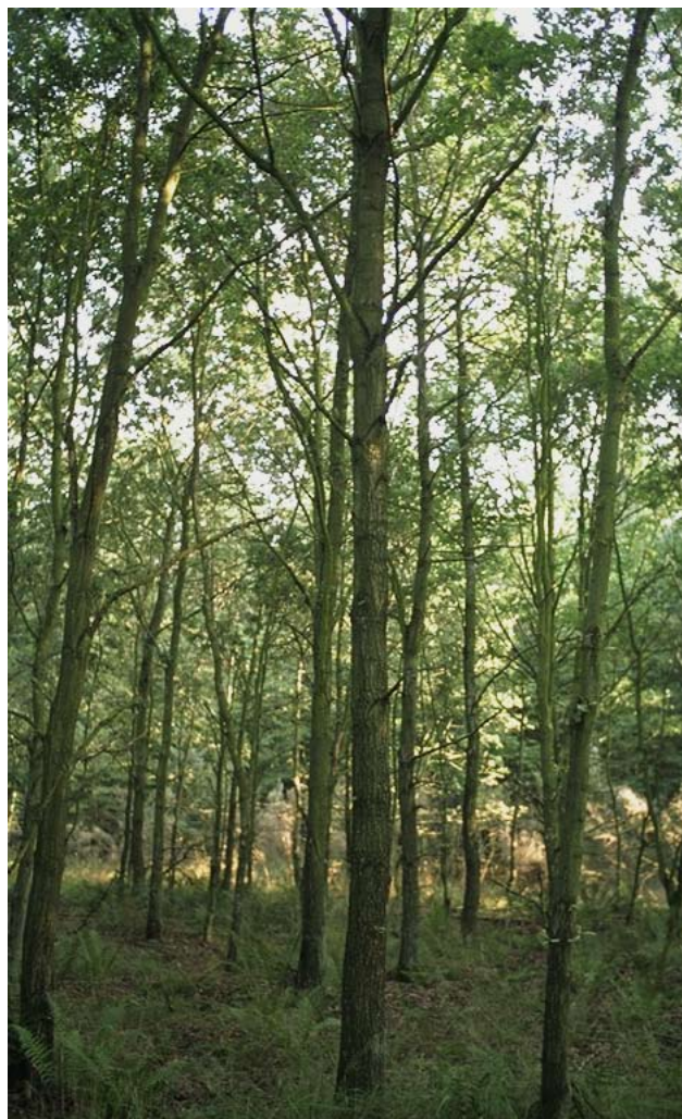
Foto 1. Afkom af Hald Ege indgår i proveniensforsøg anlagt i C.E. Flensborgs Plantage (nord for Viborg). Med hensyn til stammeform klarer afkommet sig relativt godt på denne lokalitet.

Væksten svarer formentlig til anden jysk vintereg. I øvrigt er væksten af mindre betydning i de situationer, hvor materialet anvendes.