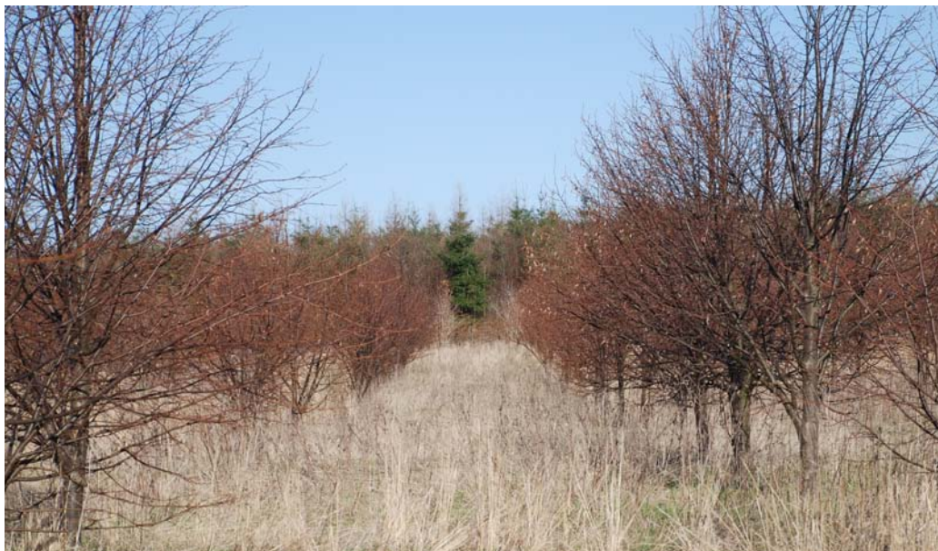
FP.275 „Udby, Møn“ i april 2010.

Det vigtigste kriterium for udvælgelsen har været materialets robusthed og tilpasningsevne.