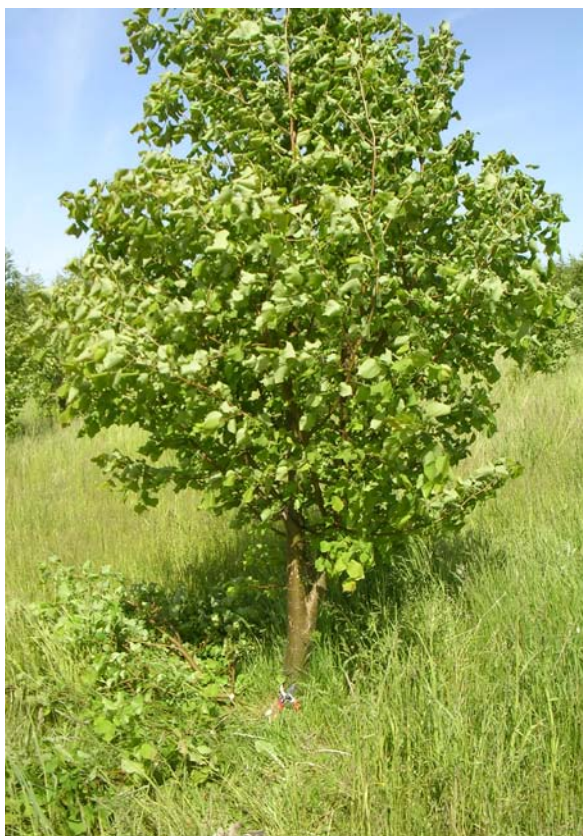
Grundstammeklip i FP.275 i maj 2008.