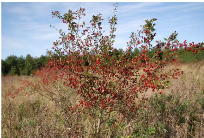
Podet plante i frøplantagen.

Andre egenskaber: Der er ikke foretaget egentlig selektion for andre egenskaber end sundhed. De enkelte kloners særlige egenskaber er dog registreret og beskrevet (størrelse, grenbygning, frugtstørrelse m.v.), og disse klonvise oplysninger vil sammen med forsøgsresultater fra afkomsforsøgene kunne bruges, hvis man ønsker at indsamle frøpartier efter særlige egenskaber.