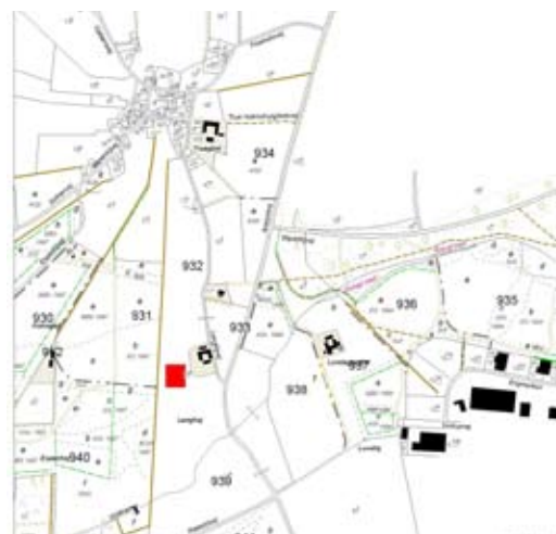
L.189 True Skov ligger lige syd for True (vest for Århus).