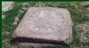
Post 1: Kongestjernen

Teksten læses højt for alle. Posterne er ikke markeret. De har særlige kendetegn, som I skal finde ved hjælp af kortet samt foto af hver post nedenfor.