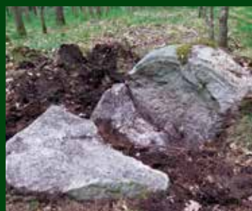
Post 3: Rillestenen