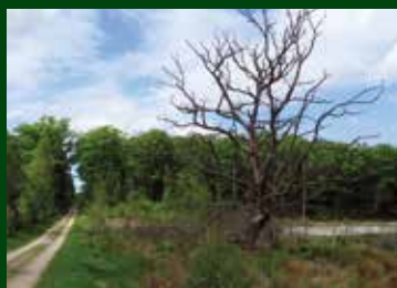
Post 4: Træet i vådområdet