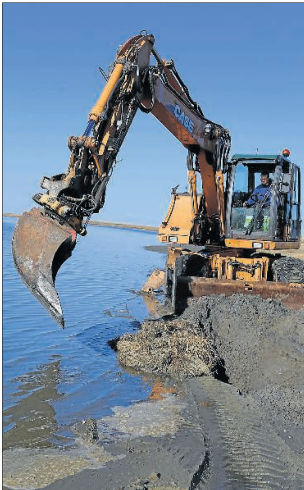
Life projektet fortsætter med at skrabe huller i sandet og grave vadegræsset ned i Sydvesten.