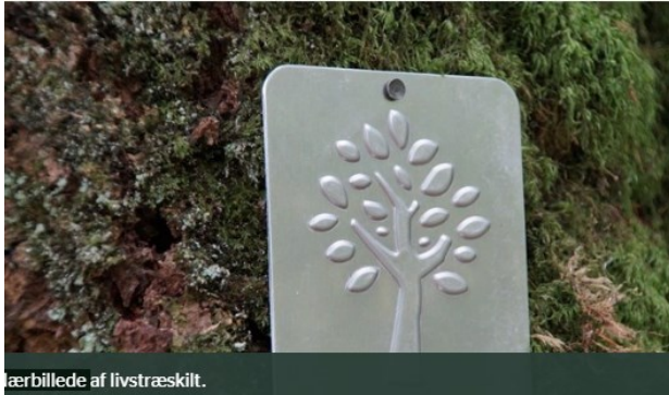
Færbillede af livstræskilt.

Når man har indstillet sit livstræ via app'en godkender eller afviser naturstyrelsens lokale enhed udpegningen. Hvis udpegningen bliver godkendt, kommer Naturstyrelsen ud og sætter et lille skilt der markerer træet for fremtiden.