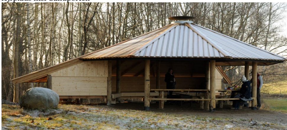
Billede af bålshelteret i Auderød Havn

Et bålshelter doneret af Esum Borgerforening vil nu blive opført på den primitive lejrplads nær Sandporten