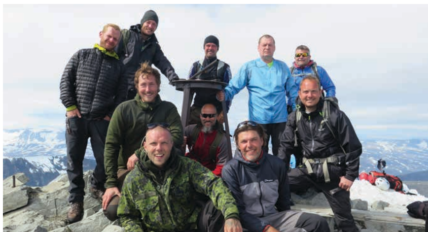
Friluftsliv er som regel en aktivitet uden konkurrence og derfor særlig god for fællesskabet. Gruppen af veteraner samlet på toppen af Nordens højeste bjerg Galdhøpiggen i Norge.

I det aktuelle projekt deltog en gruppe på 12 krigsveteraner i et ti uger langt projekt med længerevarende friluftsture og undervisning i grønne fag. Projektet blev gennemført på Skovskolen og havde til hensigt at opkvalificere veteranerne personligt og fagligt i en ramme af natur og friluftsliv. Undervisningen havde fokus på indlæring af viden og færdigheder, og friluftsturene var den naturlige arena, hvor det indlærte blev afprøvet. Friluftsliv er som regel en aktivitet uden konkurrence og derfor særlig god for fællesskabet. Det styrker samhørigheden mellem mennesker og omgivelser. De resultater, der præsenteres her,