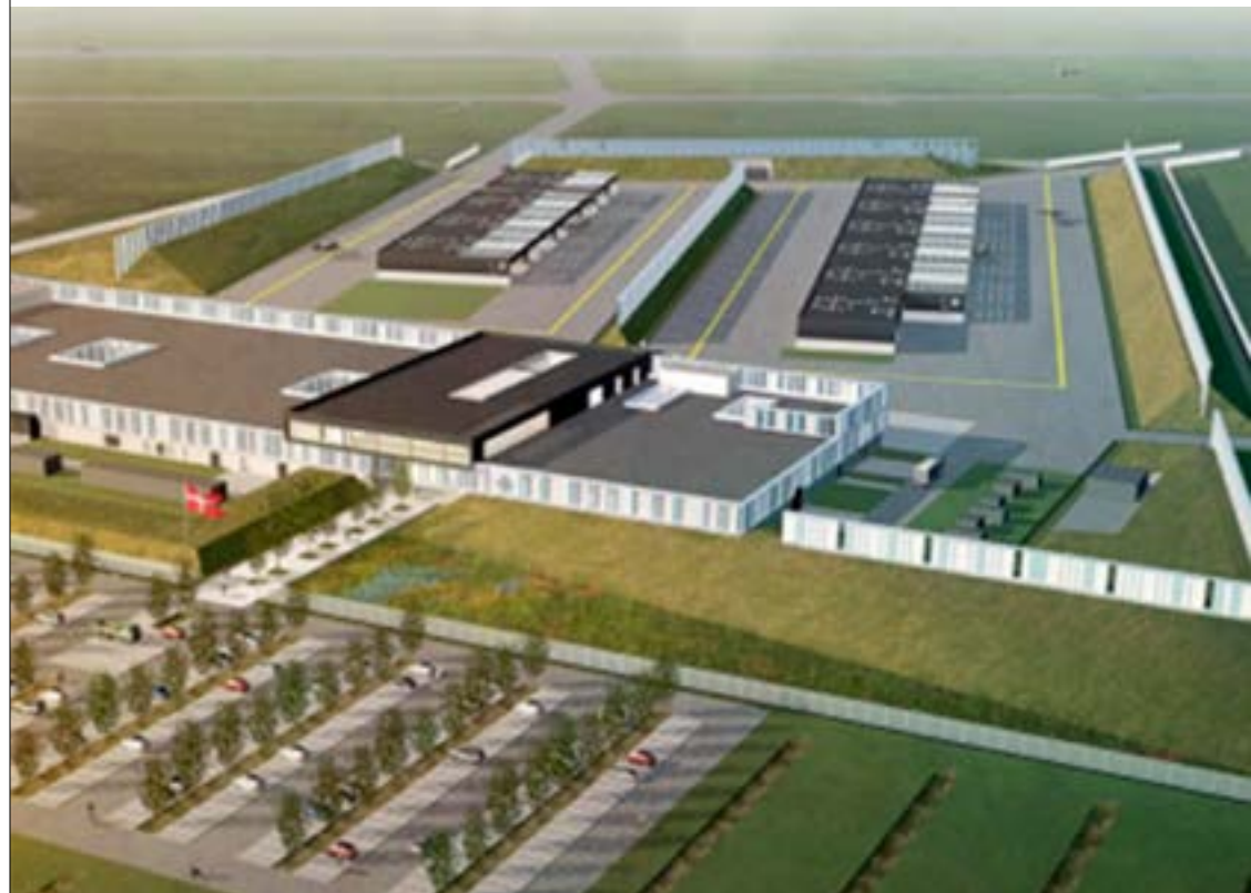
F-35 Campus skal stå færdigt til at tage imod det første fly i 2023.