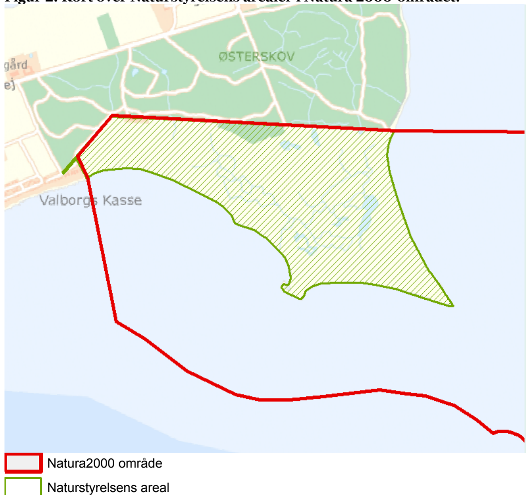
Figur 2: Kort over Naturstyrelsens arealer i Natura 2000-området.

Inden for området ejer Naturstyrelsen hele landarealet, der består af strandenge, strandvolde vandhuller og overdrev, i alt 38 ha. Heraf er 25,8 kortlagt som lysåbne habitatnaturtyper. De ældste strandvolde indeholder værdifulde og artsrige overdrev, der indtil 1979 var voksested for orkideen skrueaks. Størstedelen af overdrevene forekommer på kalkrig bund, en mindre del på sur bund. Strandengen er ligeledes meget artsrig og levested for flere arter af måge- og vadefugle. Der findes en lille, næringsrig sø og næringsfattige vandhuller. Området er levested for bilag 4 arterne strandtudse og springfrø. Arealet er udlagt til ekstensiv helårsafgræsning med robust kvæg og dele af de områder, der i dag ikke er registreret som naturtyper er under udvikling til naturtyperne surt overdrev og kalkoverdrev.