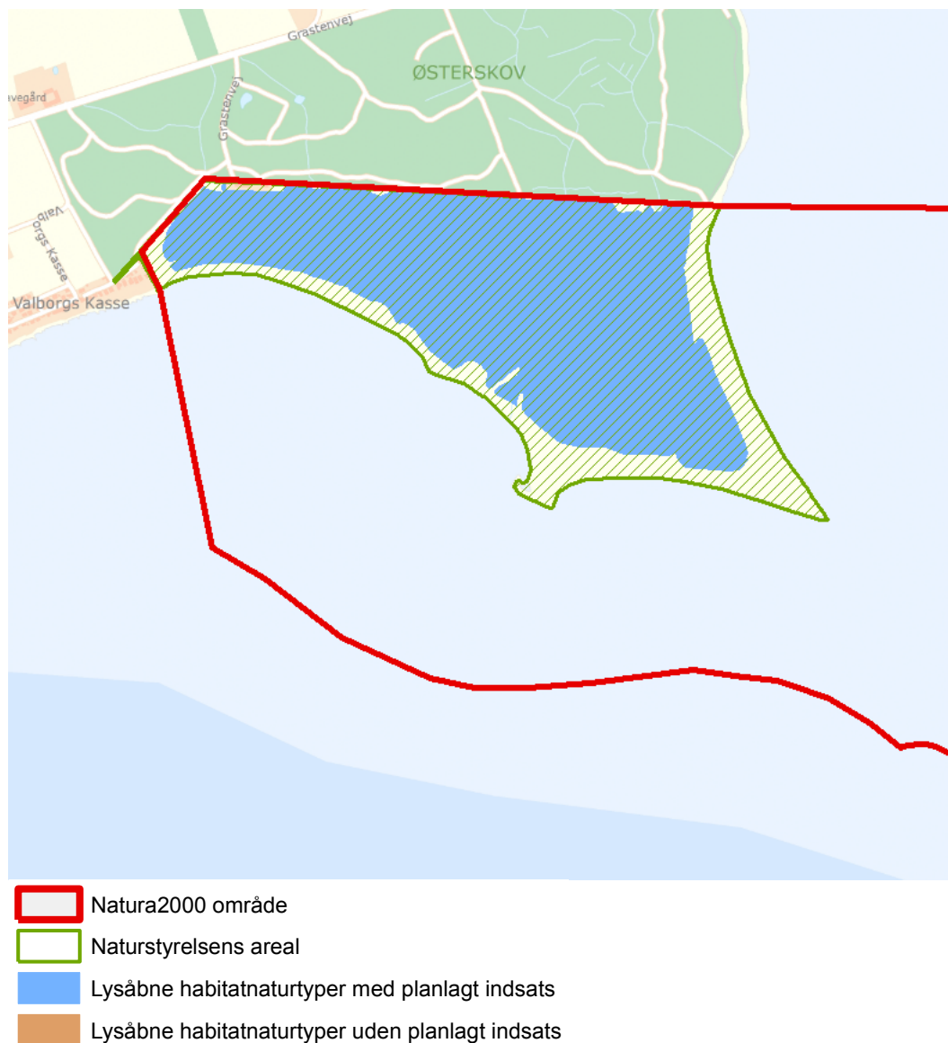
Figur 3: Oversigt over lysåbne naturtyper og planlagte indsatser i Natura 2000-området

Plejeplanen er udarbejdet i overensstemmelse med Natura 2000-planens målsætninger og adresserer konkret følgende områdespecifikke retningslinjer fra Natura 2000-planens indsatsprogram: