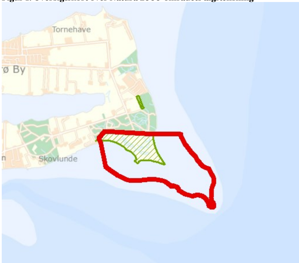
Figur 1: Oversigtskort over Natura 2000-områdets afgrænsning

Denne plejeplan følger op på Natura 2000-planen for område N242 Thurø Rev og vedrører Naturstyrelsens arealer på 38 ha.