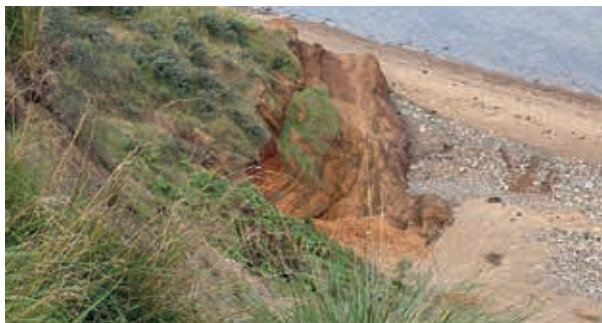
Den Røde Sten 4

Moleret indeholder ca. 200 vulkanske askelag. Hvert sort lag repræsenterer således et vulkanudbrud i den geologiske pladeåbning af Nordatlanten imellem Norge og Grønland. Asken blæste ind fra nordvest og sank til bunds i havet.