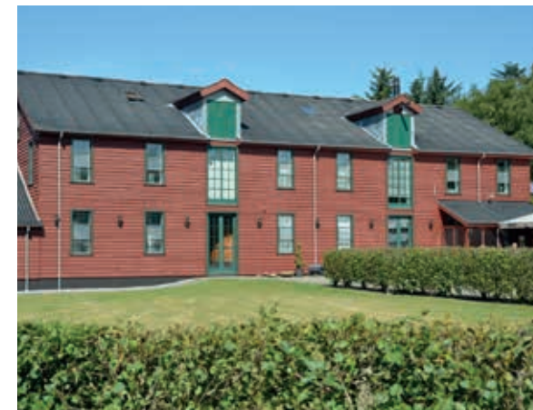
Det gamle molerværk - i dag Fur Bryghus 3

I 1926 begyndte den første brydning af moleret. Moleret blev udgravet med håndkraft og kørt med små tipvognstog til bearbejdning på molerværket 3 og videre til skibe fra en høj udskibningsbro på sydkysten. I dag graves og forarbejdes hovedparten af moleret på øen af de to molerindustrier. Moler anvendes til bl.a. varmemefaste sten i ovne samt isolering, og de absorberende evner udnyttes til så forskellige formål som dynamitstænger og kattegrus.