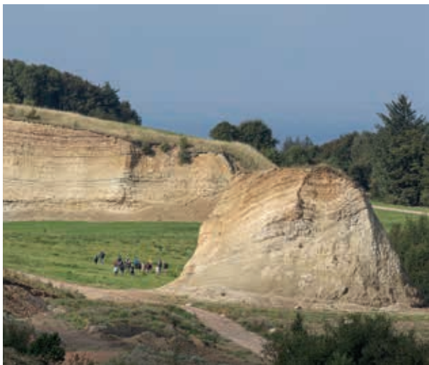
Stendal molergrav, Bispehøjen 6

Fra gravhøjene på toppen af bakkeryggen er der udsigt over hele øen, og landskabet bærer præg af at have henligget som uopdyrkede græsningsarealer gennem århundreder. Mod syd breder det flade frugtbare agerland sig. Landsbyerne med oprindelse i vikingetiden har udviklet sig til en næsten sammenhængende langstrakt bebyggelse langs de vigtigste veje. En stor gletsjer skabte under sidste istid det højtliggende bakkeland med talrige slugter og dale.