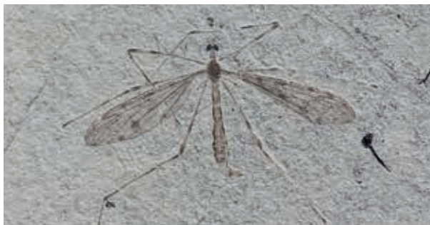
Fossil fra Fur Museum 9

Ved Knudeklinterne 1 2 og Østklinten 4 og i molergravene 6 kan man se, hvordan isens enorme kræfter har skubbet moleraflejringer op i stejle flager og folder. Moler består af 1/3 ler og 2/3 skaller fra de over 100 forskellige slags bittesmå kiselalger (diatoméer), der levede i det subtropiske hav, som for 54 millioner år siden dækkede det meste af Danmark. På grund af de næsten iltfrie forhold på bunden af fortidshavet blev kiselalgerne, fisk, dyr og planter bevaret som meget fine fossiler. Gå selv på fossiljagt i molergraven 6 eller se de flotteste på Fur Museum 9.