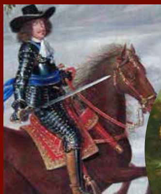
Frederik III og hans søn Christian V

Læs om hele verdensarven på www.parforce.dk .