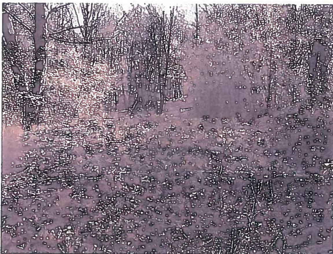
Fundamentet af statstelegrafens radiostationshus set fra nord

I 1926 lejede Statstelegrafens sig ind på Vestvolden og opførte en radiostation der eksperimenterede med retransmission af udenlandske radiosignaler og anden forsøgsvirksomhed. Aktiviteten ophørte i 1929 48 , og i dag er de eneste spor af denne aktivitet et eller flere fundamentler på voldkrone og ramper umiddelbart syd for Horsedammens fredskrudtmagasin.