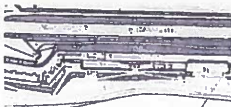
Fundamenternes placering ved Horsedammens Fredskrudtmagasin (1h). Nr. 3 ses på billedet o.f.

I 1926 lejede Statstelegrafens sig ind på Vestvolden og opførte en radiostation der eksperimenterede med retransmission af udenlandske radiosignaler og anden forsøgsvirksomhed. Aktiviteten ophørte i 1929 48 , og i dag er de eneste spor af denne aktivitet et eller flere fundamentler på voldkrone og ramper umiddelbart syd for Horsedammens fredskrudtmagasin.