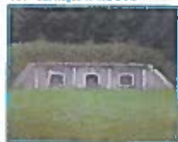
Pillerne 2 stk store + 2 stk små