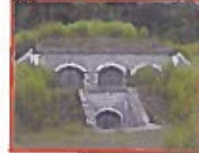
Fredningsmagasin, stort 8 stk