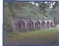
Skransestøt 7 stk