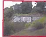
Ammunitionsmagasinet 14 stk