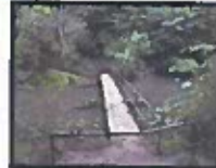
Fredningsmagasin, lite 3 stk