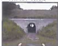
Betårnsene 1 stk