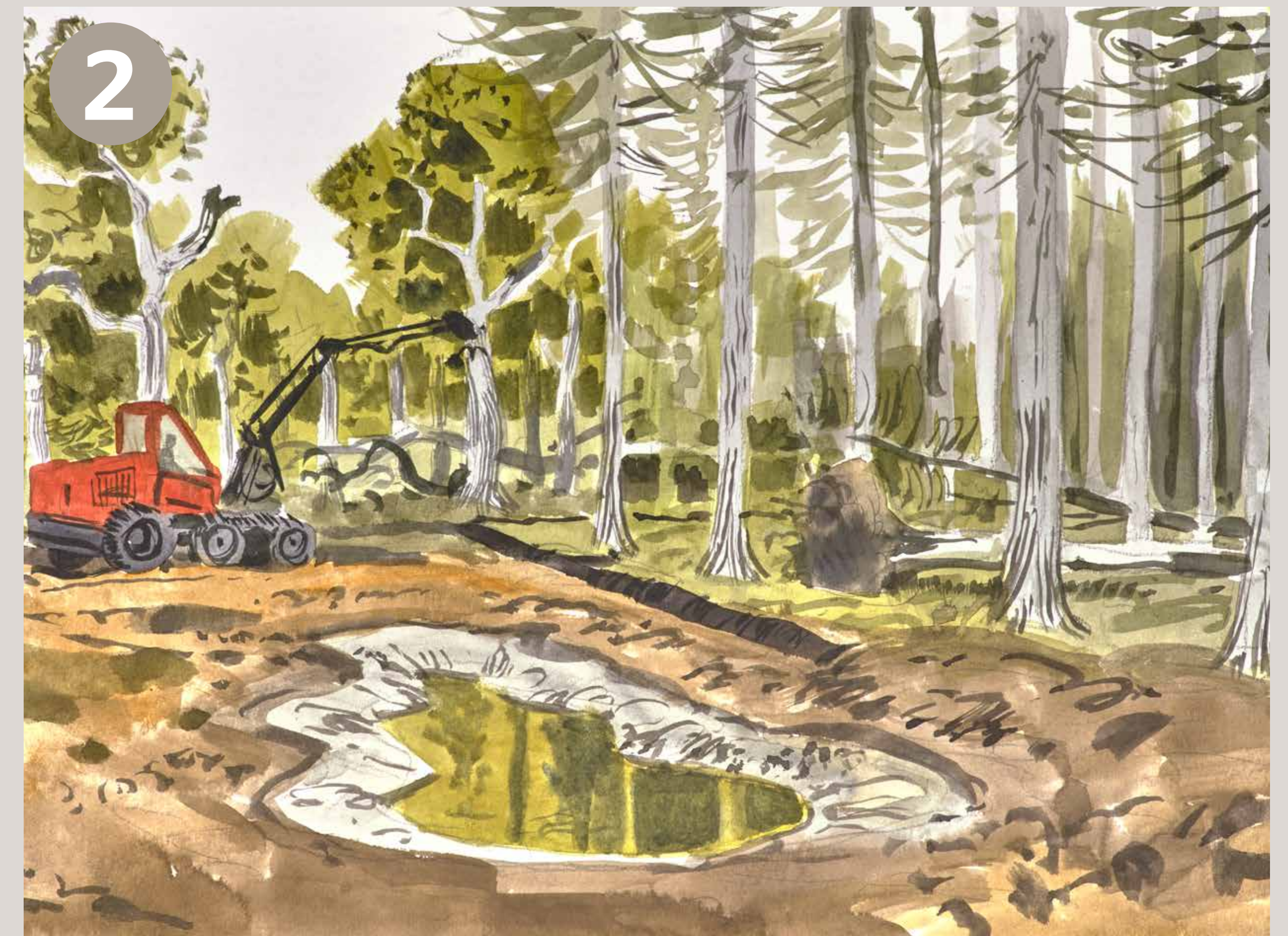
2 For at hjælpe naturen på vej til at blive mere varieret vil der blive foretaget indgreb i plantageskoven. Ensartede beplantninger brydes op, træer veteraniseres, grøfter dækkes til og der bliver etableret enkelte nye vandhuller.