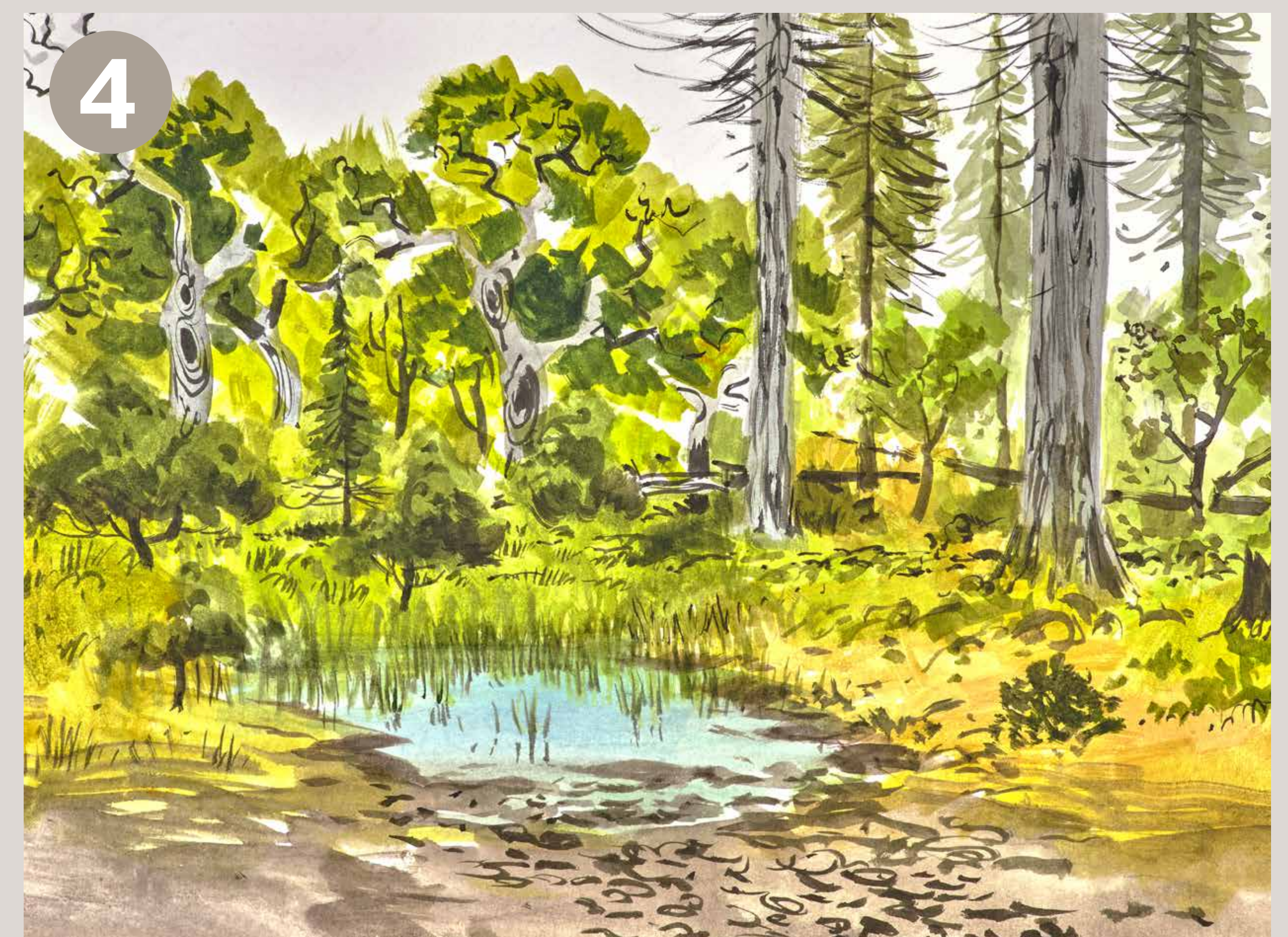
4 Målet med det hele er en rig og varieret natur, hvor de naturlige processer får frit spil med minimalt behov for indgreb fra os mennesker. Vild og selvforvaltende natur som dette er en sjældenhed i Danmark og giver mulighed for en større artsrigdom.