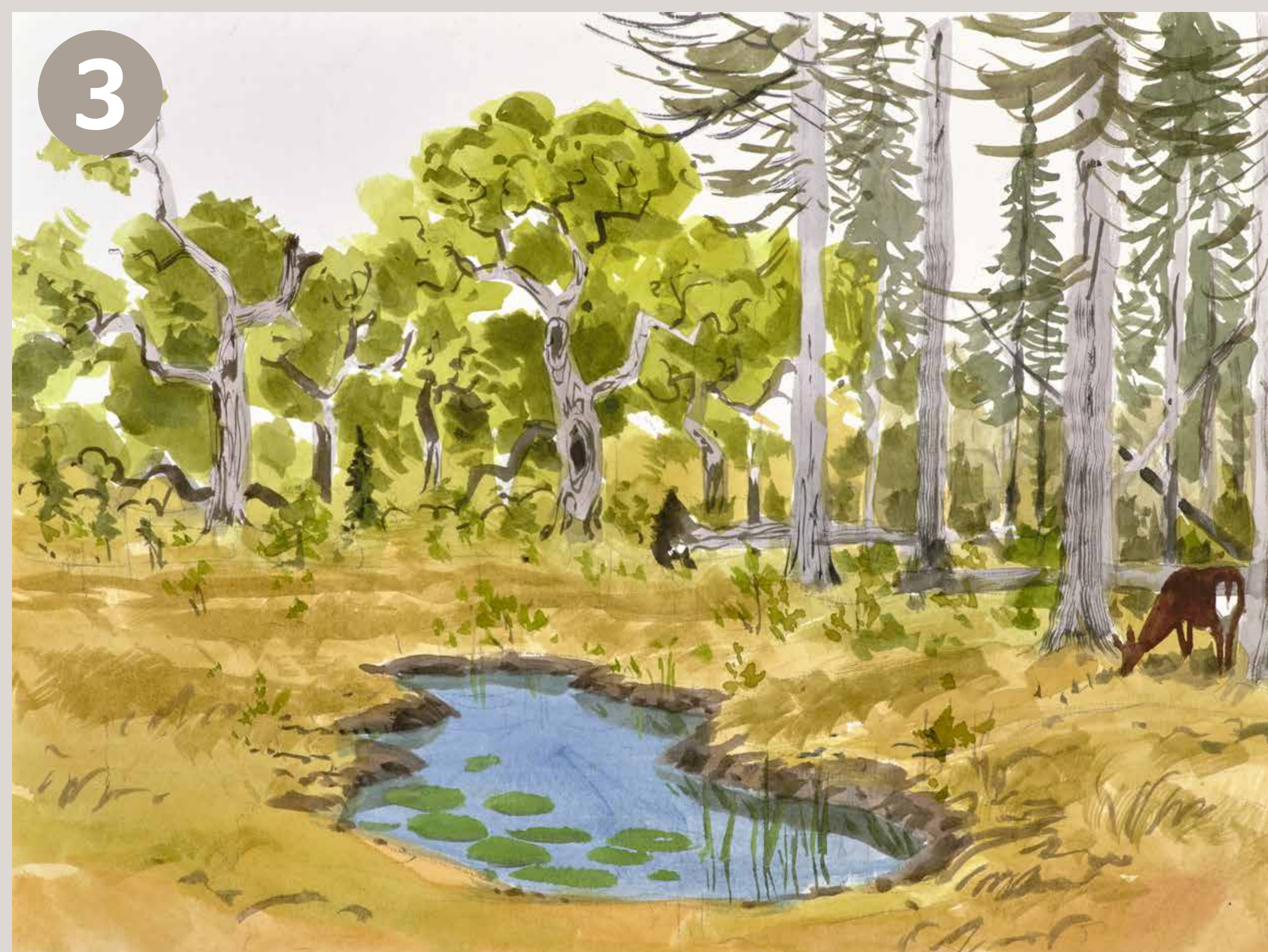
3 Sporene efter indgrebene vil kunne ses i nogle år, men ret hurtigt vil naturens processer tage over. Andre træsorter vil begynde at vokse op i de ensartede beplantninger, terrænet bliver vådere og de store, græssende dyr begynder at påvirke naturen.