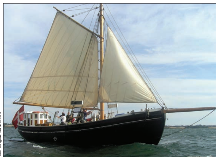
Der er mulighed for at opleve stemningen ombord på Mjølner, som sejler rundt i Øhavet.