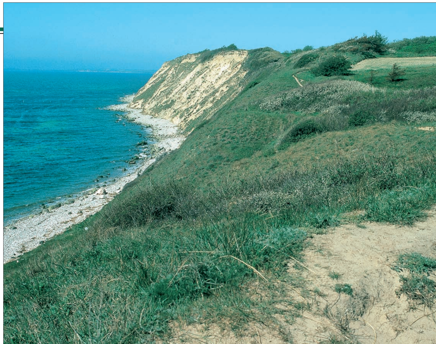
Ristinge Klint, hvorfra man har en flot udsigt over Det Sydfynske Øhav.

Under 2. verdenskrig blev der gravet tørv i noret.