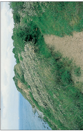
Se langs klintens overkant

Skov- og Naturstyrelsen ejer en ca. 100 m. bred zone langs med klinten. Herved er de besøgende sikret muligheden for gode naturoplevelser, samtidig med at der er mulighed for at de vilde planter på skrænterne kan brede sig længere ind i landet. Langs med hele klinten kan du følge en sti, hvorfra du kan nyde udsigten over havet. Der er i samarbejde med ejerne også etableret en sti over private jorde, så man har mulighed for at opleve nord-siden af halvøen og Ristinge Nor.