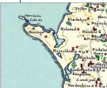
Videnskabernes Selskabs Kort år 1783. Her ses bugten før inddæmningerne (Norene) ved Ristinge og Nørballe.

Ristinge Klint viser en 130.000 år lang historie, da lag fra hele den sidste mellemistid og sidste istid hele tiden blottes. Og det helt specielle er, at lagene står på højkant. Cyprinaleret er dels aflejret i en sø og dels i havet under sidste mellemistid, hvor temperaturen var som ved nutidens sydfranske kyster. Det hårde ler ses som fremspring langs klinten. Det Hvide Sand er slebet og aflejret af polarvinde, der blæste bort fra en gletsjer. Lagene af moræneler og smeltevandssand er aflejret af tre gletsjere. Den yngste gletsjer har brudt lagene op og stablet dem på højkant, og dækkede klinten med et lag af moræneler. Når du går en tur langs stranden, kan du se den samme lagerie gentage sig mindst 34 gange. Ristinge Klint har international betydning for forskning og undervisning.