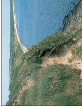
Udsigt fra klinten ned mod stranden