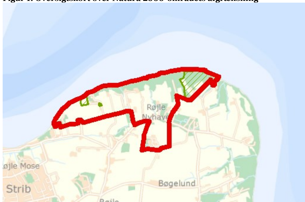
Figur 1: Oversigtskort over Natura 2000-områdets afgrænsning

Denne plejeplan følger op på Natura 2000-planen for område N111 Røjle Klint og Kasmose Skov og vedrører Naturstyrelsens arealer på 19 ha.