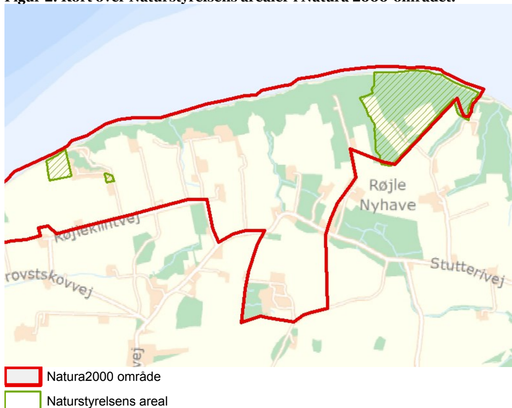
Figur 2: Kort over Naturstyrelsens arealer i Natura 2000-området.

Indenfor Natura 2000- området ejer Naturstyrelsen ca. 22 ha, hvoraf størstedelen ligger i Kasmose Skov, som er omfattet af naturskogsstrategien. Den gamle skov inkl. skrænter og strandbred blev i 1993 udpeget til urørt skov, men sidste egentlige gennemhugning skete i 1981. Skoven har altid været svært fremkommelig og dyrkningen derfor tilsvarende ekstensiv. En mindre del af skoven blev i 1981 afdrøvet og tilplantet med eg, mens resten af skoven formodentlig er fremkommet ved naturlig foryngelse. Kystskrænten ud for skoven er stejl og består især af plastisk ler. Her findes slugter med jordflydning og mange væld. Resten af arealet – arealer, der tidligere har været i landbrugsmæssig omdrift, en ældre askebevoksning mod øst samt egekulturen mod vest og kildevæld er udlagt til ekstensiv helårsafgræsning med robust kvæg. De tidligere omdriftsarealer er under udvikling til naturtypen kalkoverdrev. I Kasmose Skov er der en rig og særpræget flora tilknyttet kalkrig jordbund. På Røjle klint findes et veludviklet kalkoverdrev der indgår i en græsningsdrift med private arealer.