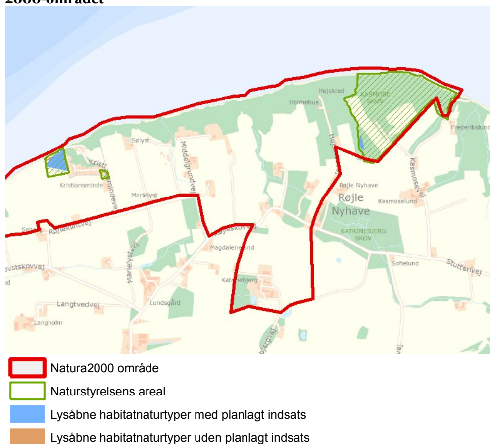
Figur 3: Oversigt over lysåbne naturtyper og planlagte indsatser i Natura 2000-området

Plejeplanen er udarbejdet i overensstemmelse med Natura 2000-planens målsætninger og adresserer konkret følgende områdespecifikke retningslinjer fra Natura 2000-planens indsatsprogram: