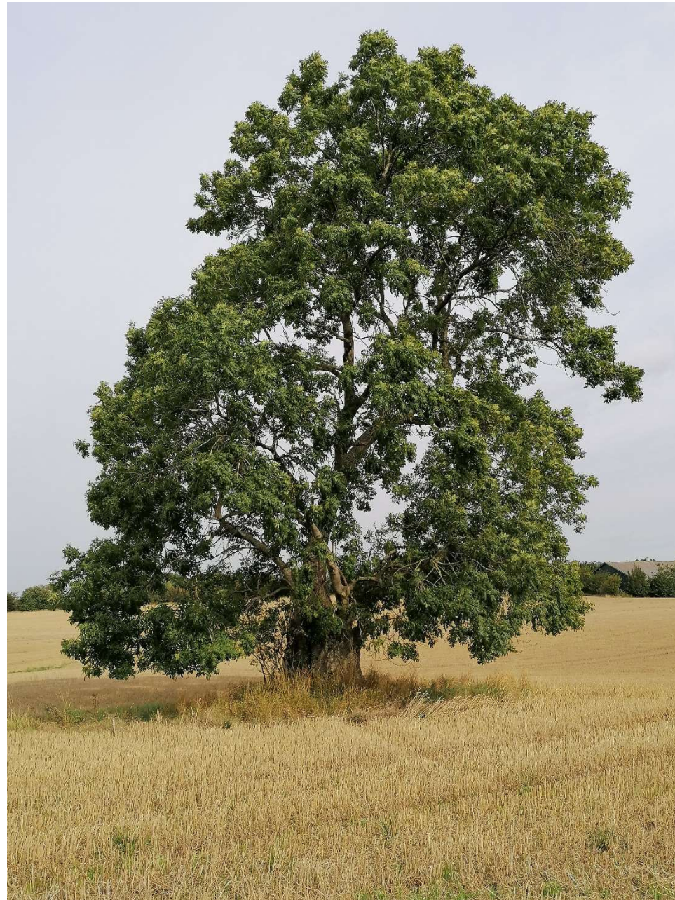
Det gamle asketræ på marken nord for Brahesborgvej kan snart se frem til selskab.