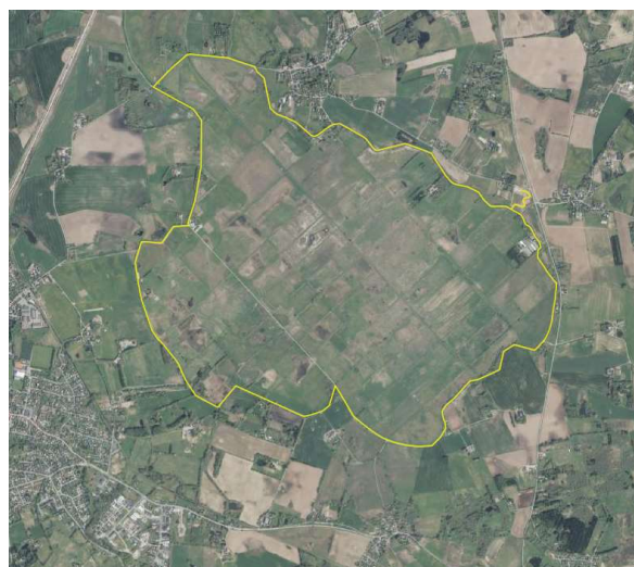
Sti rundt om den sydlige sø

Stier i den sydlige del af området er færdige. I løbet af foråret vil det blive sat en række bænke op og flere informationstavler. Ruten om den sydlige sø er 10 km og vist med gult nedenfor. Den kan også findes på hjemmesiden udinaturen.dk .