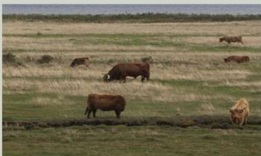
Græsning med f.eks. kvæg er med til at forbedre naturindholdet på engene ved søen.

Læs mere på hjemmesiden: www.naturstyrelsen.dk