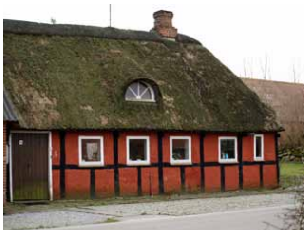
Landsbyhus i Velds (syd for Ørum)