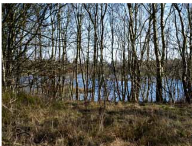
Sø mellem Them og Vrads, set gennem træbevoksning en vinterdag