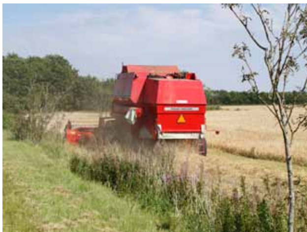
Høstarbejde ved Sunds (nord for Herning)