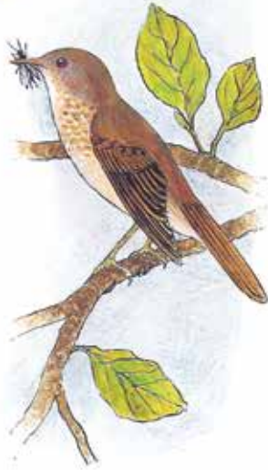
Nattergalen nyder godt af de mange insekter og larver

Egetræet huser mange insekter. Egen har groet længe i Danmark, hvilket betyder, at flere hundrede forskellige insektarter har tilpasset sig et liv på egetræer. F.eks. forskellige galhvepse som lægger deres æg på bladene, og derved får bladet til at udvikle en galle, som larven lever i og af.