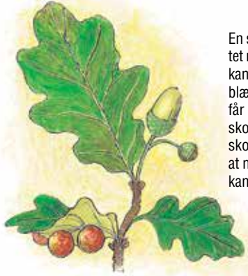
Eg med galler

Egetræet huser mange insekter. Egen har groet længe i Danmark, hvilket betyder, at flere hundrede forskellige insektarter har tilpasset sig et liv på egetræer. F.eks. forskellige galhvepse som lægger deres æg på bladene, og derved får bladet til at udvikle en galle, som larven lever i og af.