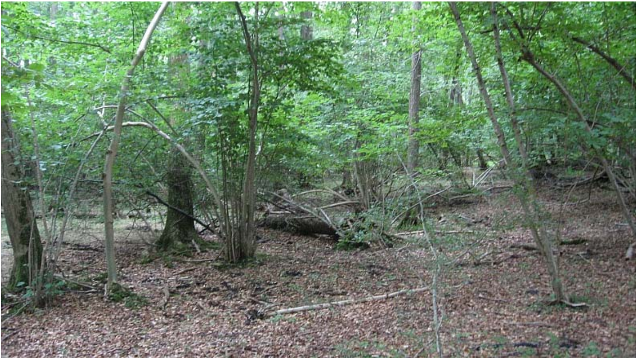
Billede 3 Urørt græsningsskov, Ajsrup