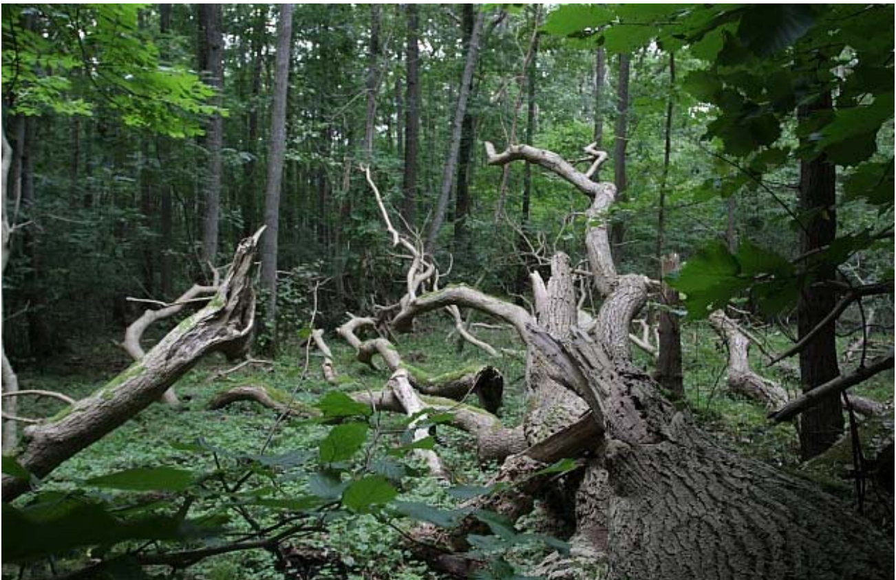
Billede 2 Dynamik i naturskoven. Død ask, gi'r nye livsmuligheder for skovens flora og fauna.