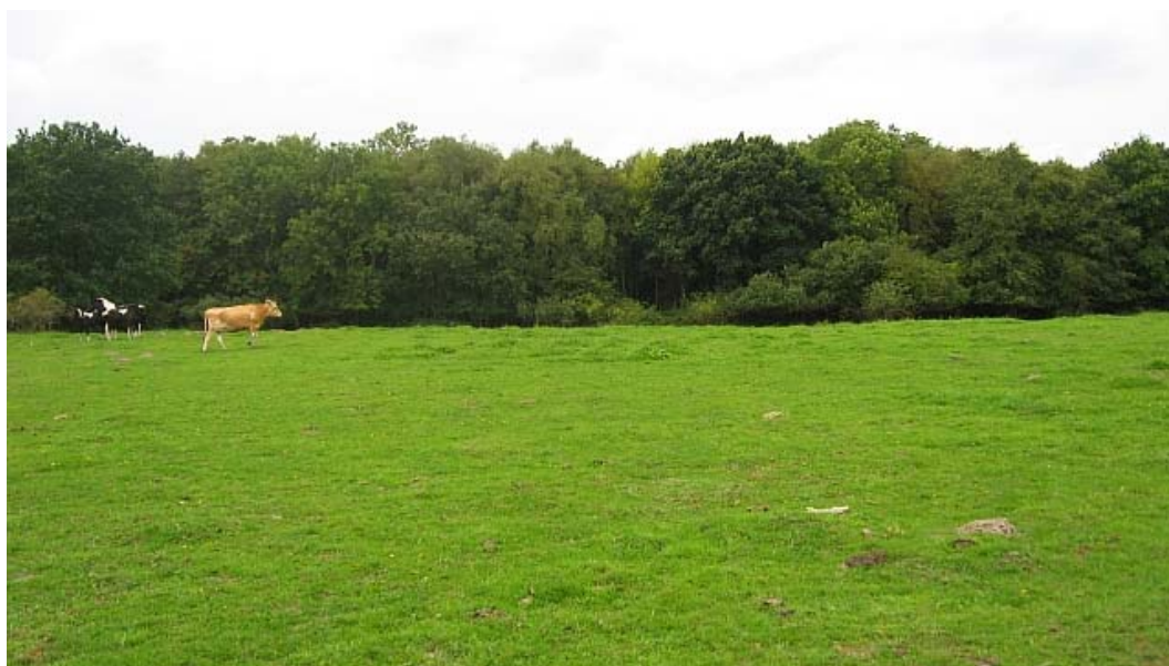
Billede 4 Kreaturerne græsser såvel strandeng og overdrev som elle-/askeskoven, Ajstrup

Naturstyrelsen iværksætter i planperioden ikke særlige indsatser rettet specifik mod arter. Plejen af områdets naturtyper vil samtidig tilgodese en række arter på udpegningsgrundlaget.