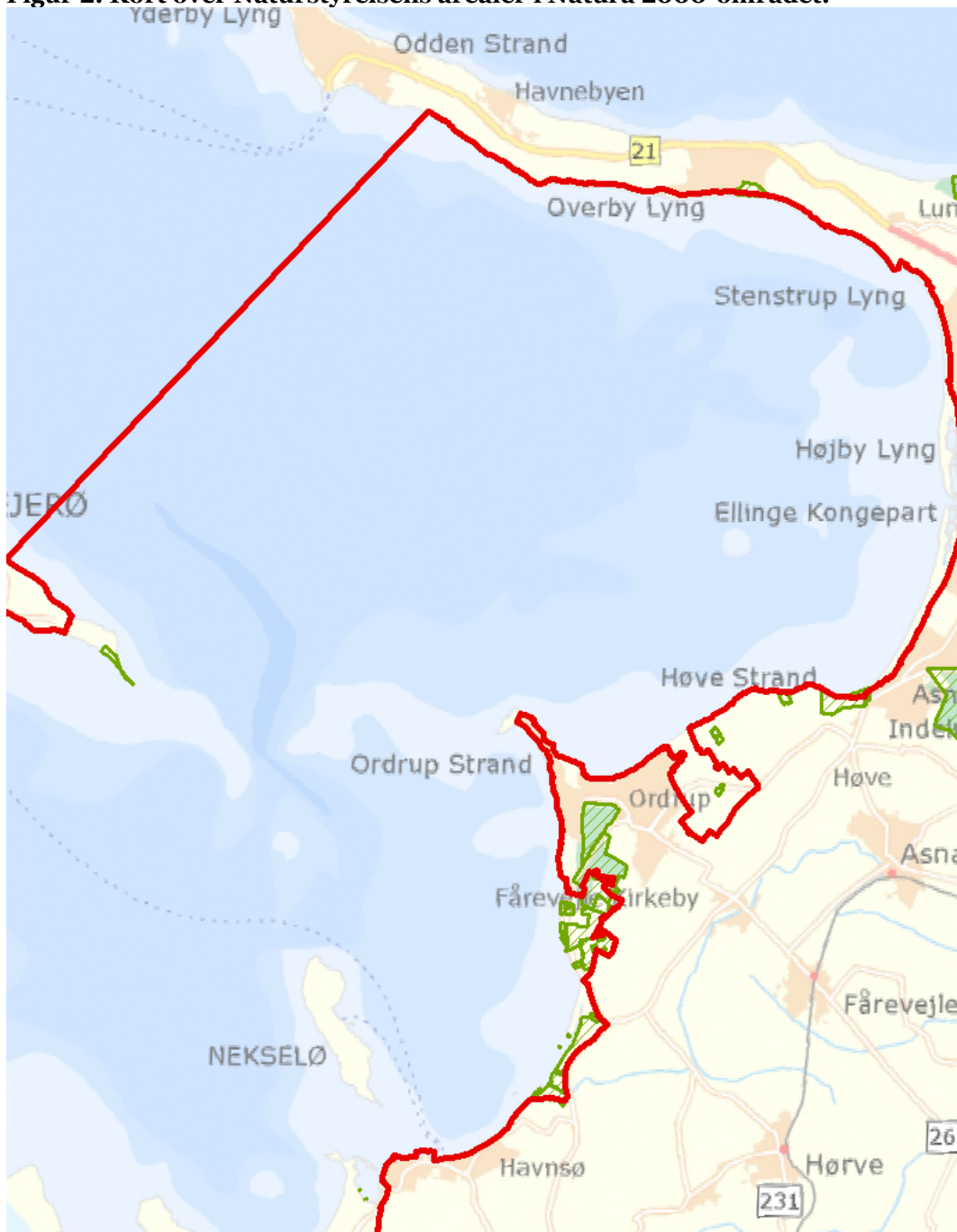
Figur 2: Kort over Naturstyrelsens arealer i Natura 2000-området.