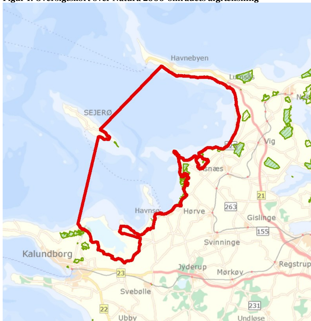
Figur 1: Oversigtskort over Natura 2000-områdets afgrænsning

Denne plejeplan følger op på Natura 2000-planen for område N154 Sejerø Bugt, Saltbæk Vig, Bjergene, Diesbjerg og Bollinge Bakker og vedrører Naturstyrelsens arealer på ca. 203 ha.