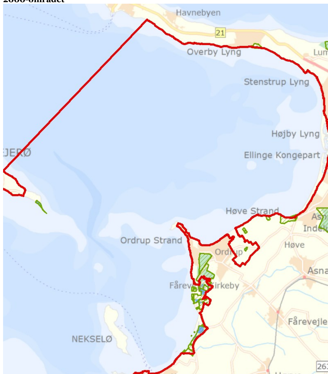
Figur 3: Oversigt over lysåbne naturtyper og planlagte indsatser i Natura 2000-området