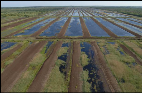
Gravebanerne i 2008 og 2009. Det kunne være spændende at se, hvordan området tager sig ud set fra luften her fem år senere.