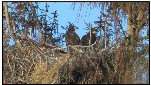
Havørn, 3 unger i reden

Ingen stationær forekomst og dermed indikation på ynglevirksomhed i Lille Vildmose. Ses hyppigt i træktiderne, blandt andet skal nævnes hele 8 fugle 25/7 i forbindelse med et stort influx af arten i Nordjylland – primært Skagen. Rød Glente er bemærkelsesværdigt nok endnu ikke fundet ynglende i det østlige Himmerland i ”nyere tid”.