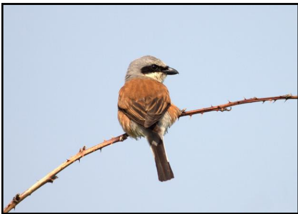
Rødrygget Tornskade, 7. juli

En ung han blev under punkttællingen den 6/6 set og hørt synge i Tofte Skov, Østerskoven nær Storkeegen. På nøjagtig den samme lokalitet og på samme dato blev der fire år tidligere i 2009 også set og hørt en ung Lille Fluesnapper.