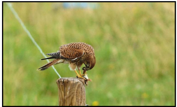
Tårnfalk, 7. august

I forbindelse med en stor forekomst i Nordjylland i oktober til december blev arten også iagttaget i Lille Vildmose, Således fire iagttagelser i december.