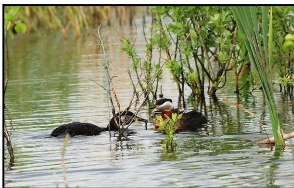
Gråstrubet Lappedykker, 28. maj

Desuden er medtaget en række observationer af usædvanlig arter, der viser, at området i stadig højere grad er attraktivt for diverse fåtallige trækgæster samt selvfølgelig ikke mindst et stigende antal besøgende, der gør, at mange af disse fugle bliver opdaget!