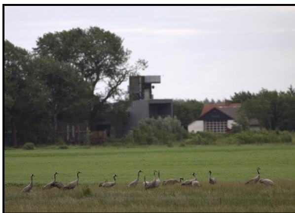
Traner, 30. juni

Som i 2012 blev alle sete og hørte fugle kortlagt på delområder, hvorved der blev registreret følgende antal territorier: 9 nord for Hegnsvej, 4 syd for Hegnsvej og 1 øst for Grønvej, i alt 14 territorier, hvilket er betydeligt lavere end i 2012. Nedgangen skal dog tage med det forbehold, at indsatsen var betydeligt mindre målrettet end i 2012.