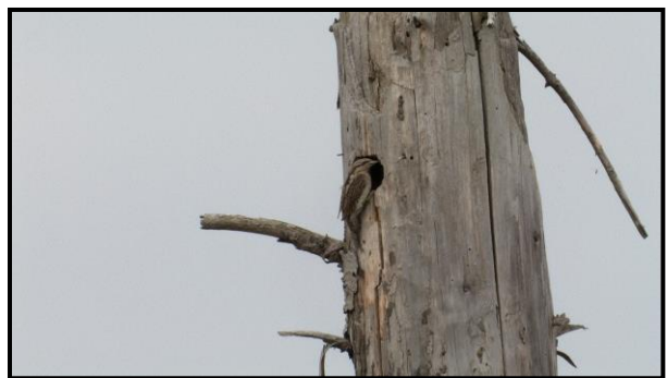
Vendehals, Tofte Skov

I Tofte Skov er arten hørt/set på Bøgebakken og i Bønderskov. På sidstnævnte lokalitet blev der set to fugle og fundet redehul.