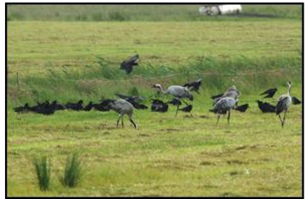
Traner og Råger, 23. juni