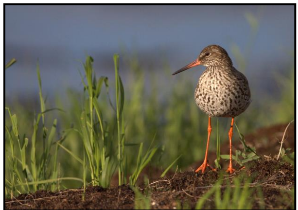
Rødben, 14. juni