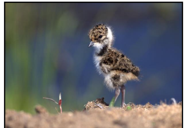
Vibe, pull. 7. juni