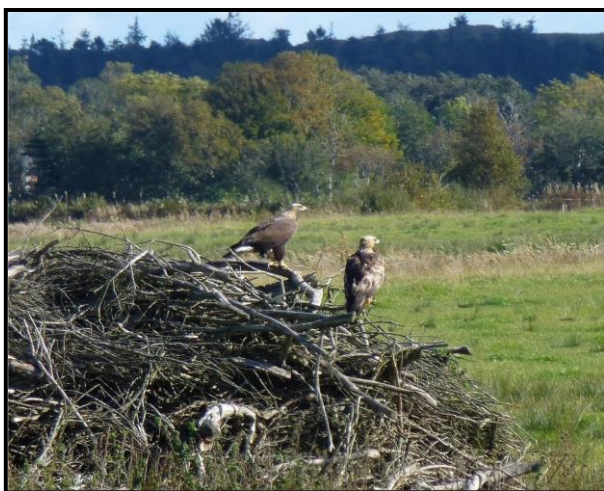
Kongeørn, han med juv.1. oktober

To iagttagelser, 17/4 1 ad. han Portlandsmosen og 31/5 1 brun forbitrækkende.