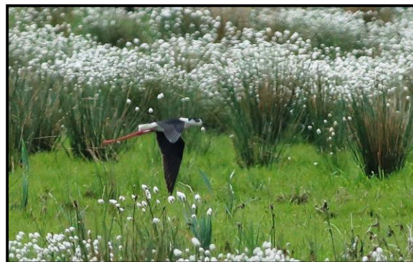
Stylteløber, 19. maj

I 2012 blev der gjort yngleforsøg af Stylteløber i Lille Vildmose. I 2013 lykkedes det for arten at få flyvefærdige unger på vingerne. Parret havde valgt at slå sig ned på et stort åbent tidligere gravefelt med store og små pytter. Hen på sommeren blev der her udsat 70 stk. gallowaykvæg. Parret blev først observeret 14/5 og blev sidst set 4/8 sammen med ungerne, der da havde været flyvefærdige i en halv snes dage. Reden befandt sig 135 meter fra Grønvej, i passende afstand til at mange besøgende kunne glæde sig over at se fuglene, samtidigt med at fuglene følte sig uforstyrrede. 24/5 påbegyndtes rugningen, og 17/6 blev pulli observeret. Det er første gang i Danmark, at Stylteløber så vidt vides har gennemført et yngleforsøg med succes. I publikationen ”Nordjyllands Fugle 2013” er der en udførlig beskrivelse af alle omstændigheder ved forekomsten. Udover ynglepåret iagttages yderligere et par 18/6.