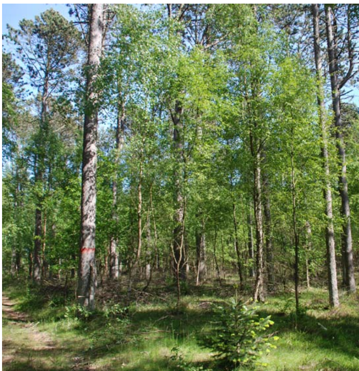
Udgangsbevoksningen i Ålbæk Plantage i 2010. Plustræerne er markeret med en rød ring.

Tynding i frøplantagen: Der er ikke planlagt tynding i frøplantagen.