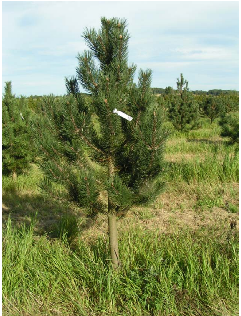
FP.268 Mosemark Skov i 2005.

Juletræer og pyntegrønt: Podningerne i frøplantagen fremstår som tætte og symmetriske, og afkommet er derfor kåret til juletræsproduktion og pyntegrønt.