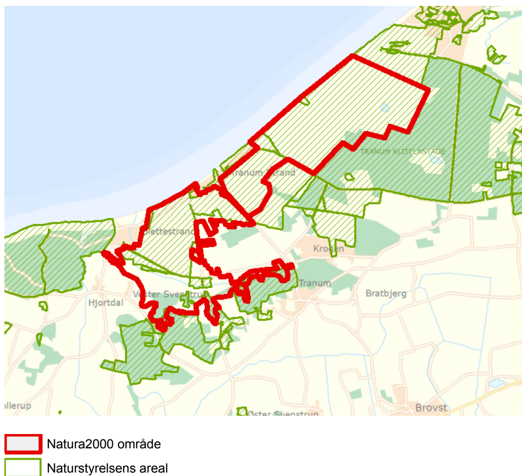
Figur 1: Kort over Natura 2000-områdets afgrænsning

I denne plejeplan er arealer og indsatser opdelt på henholdsvis lysåbne naturtyper og arter knyttet til de lysåbne naturtyper. Natura 2000 plejeplaner for de skovbevoksede naturtyper, samt mere detaljerede oplysninger om indsatsen i Natura 2000-områderne findes på Naturstyrelsens hjemmeside vedr. Natura 2000. Bemærk, at Naturstyrelsens samlede arealforvaltning i området er omfattet af flere planbestemmelser og retningslinjer end dem, der findes i denne plan. For