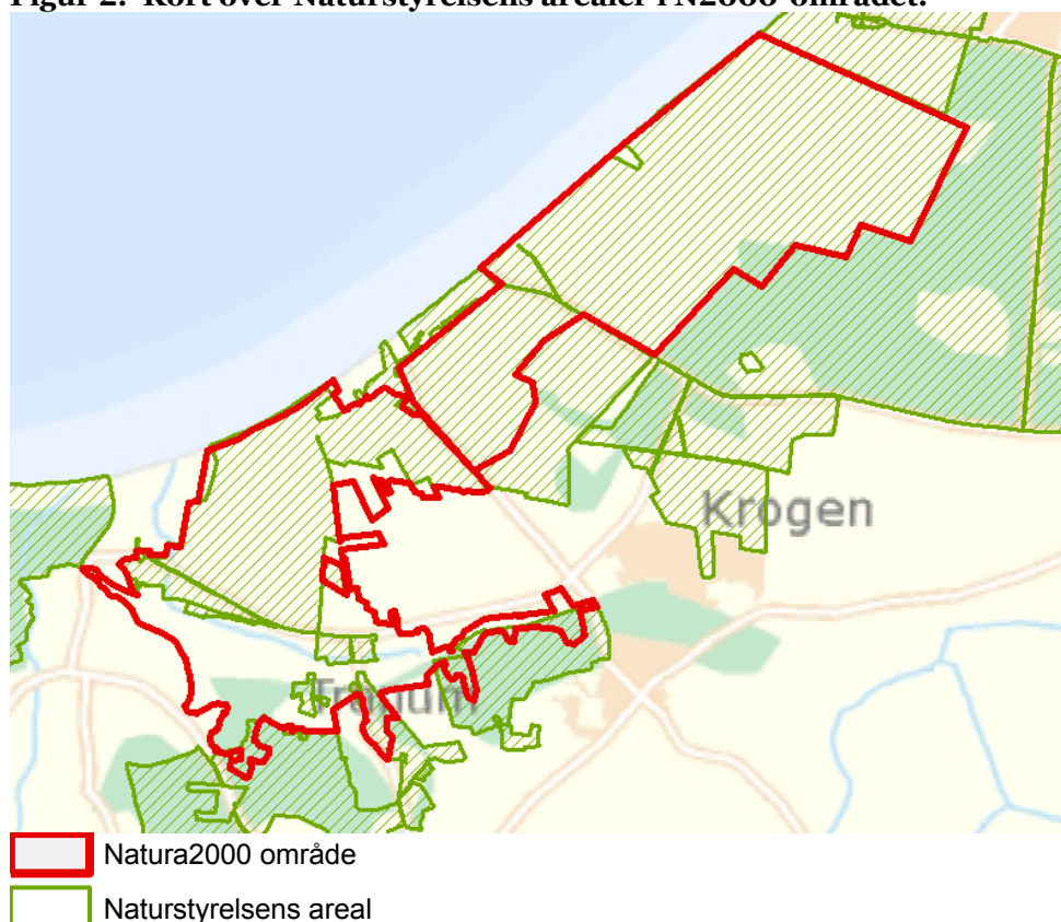
Figur 2: Kort over Naturstyrelsens arealer i N2000-området.

For en uddybende beskrivelse af Natura 2000-området, herunder præsentation af udpegningsgrundlaget for området, henvises til Natura 2000-planen . På SVANAs hjemmeside kan der også findes forklaring af begreber mv.