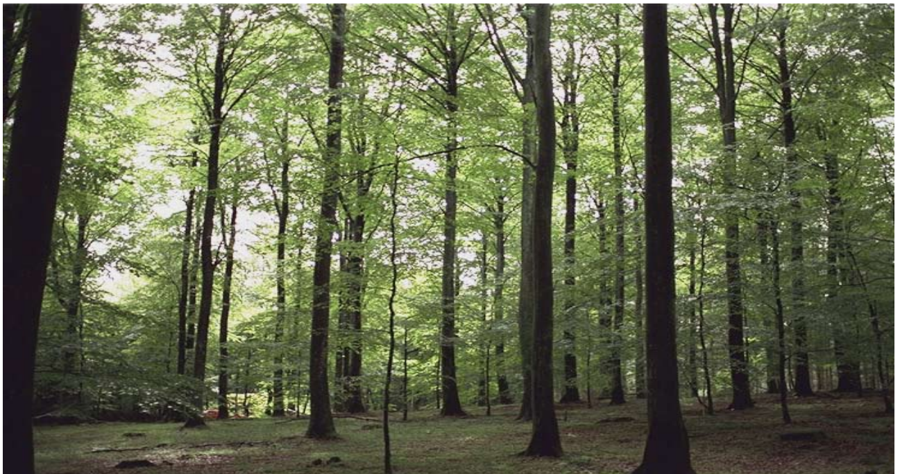
Foto fra sommeren 1999.

Henvendelse til Statsskovenes Planteavlsstation, tlf.: 49 19 02 14.