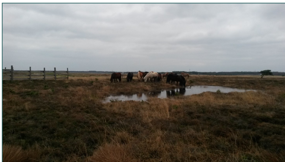
Islandske heste i den østre del af Pigestenshegnet.

Ellers har året været præget af aktivitet, som delvist beskrevet i tidligere nyhedsbreve.