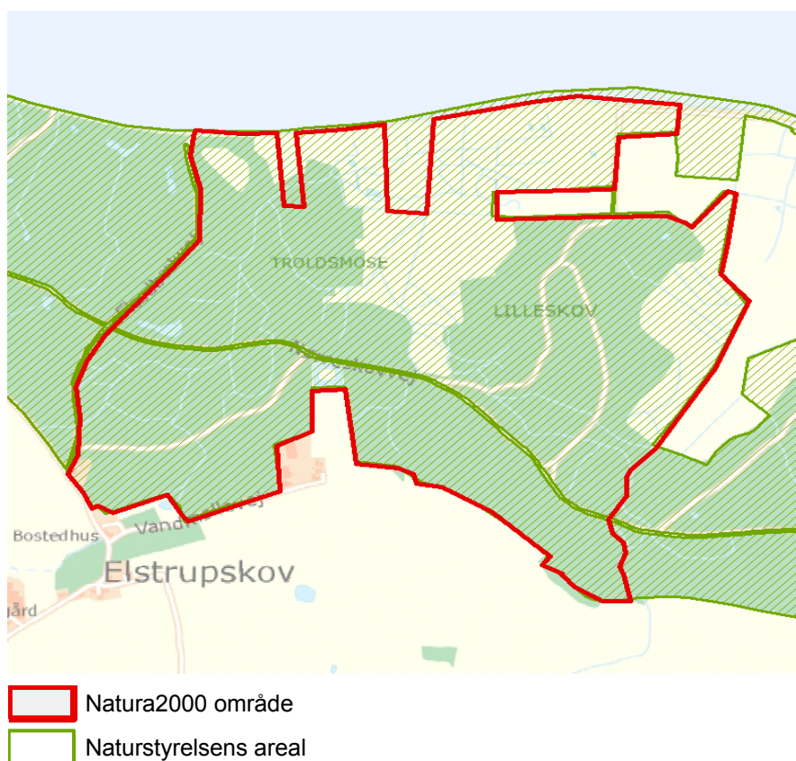
Figur 2: Kort over Naturstyrelsens arealer i N2000-området

For en uddybende beskrivelse af Natura 2000-området, herunder præsentation af udpegningsgrundlaget for området, henvises til Natura 2000-planen . På Styrelsen for Vand og Naturforvaltnings SVANA hjemmeside kan der også findes forklaring af begreber mv.