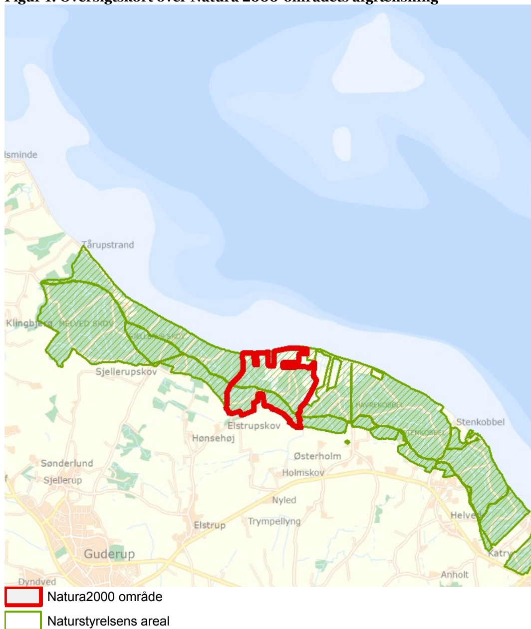
Figur 1: Oversigtskort over Natura 2000-områdets afgrænsning

Denne plejeplan følger op på Natura 2000-planen for område nr. 104 Lilleskov og Troldsmose og vedrører Naturstyrelsens arealer på 105 ha.