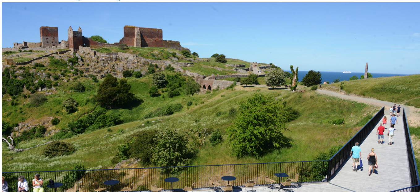
Hammershus set fra besøgscenterets tagflade.

Bygningen er i ét plan. Her finder du en ny udstilling om Hammershus' historie og desuden kiosk, café og toiletter. Tagets 1.000 m 2 store panoramadæk er udført i kerneeg fra Almindingen. Det fungerer som en forlængelse af terrænet bagved med rummelige opholdsmuligheder og optimal udsigt til Hammershus. Via en bro kan du gå over til ruinen på den anden side af slugten og på vejen fornemme suget fra Mølle dalen.