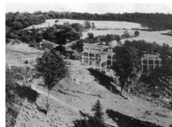
Det nye besøgscenter ved Hammershus ses her sammen med Utzons skitse fra 1971, som anviste placeringen på Mølle dalens skrænt. Her ligger bygningen godt skjult i terrænet, så den ikke stjæler scenen fra hovedrolleindehaveren: Hammershus.