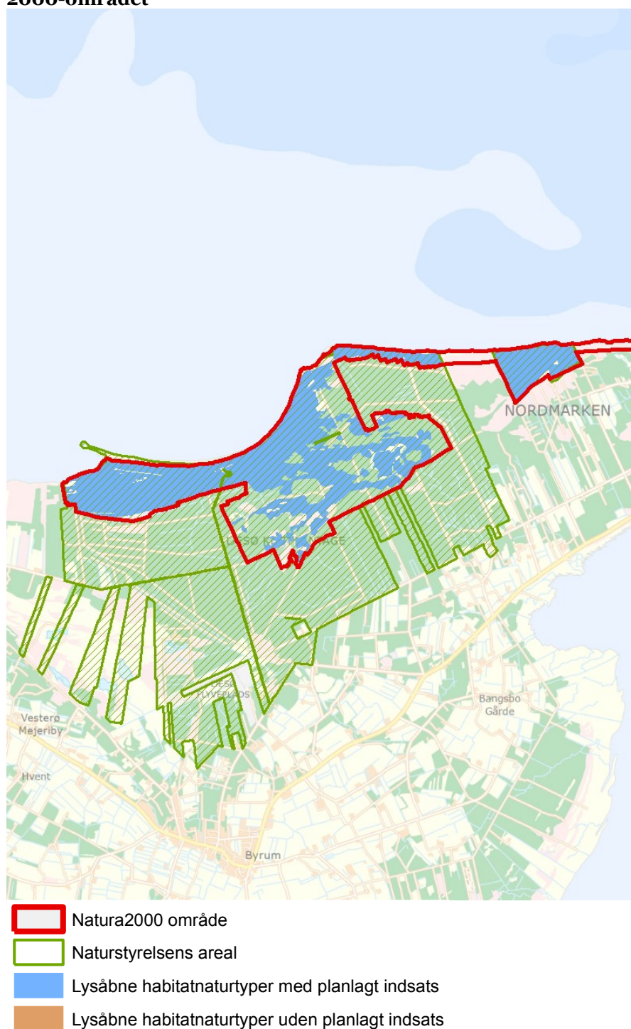
Figur 3: Oversigt over lysåbne naturtyper og planlagte indsatser i Natura 2000-området