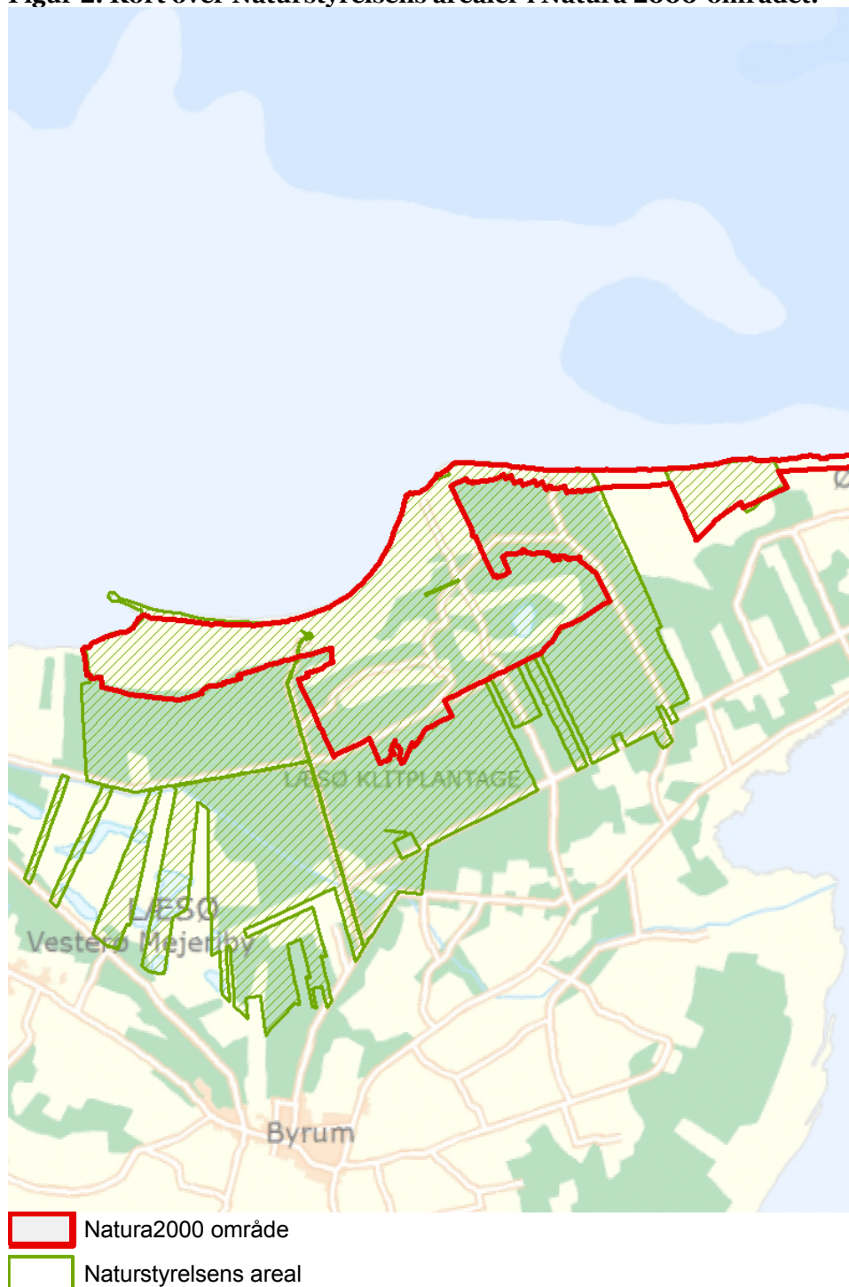
Figur 2: Kort over Naturstyrelsens arealer i Natura 2000-området.

Naturstyrelsen ejer ca. 94 % af området, det gælder Holtemmen, Store Dal, Højsande, Foldgårdsøen, Hvidebakker samt arealer i Nordmarken øst for Banstensvej.