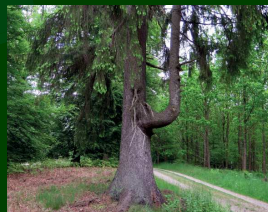
Post 2: Træet