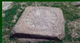
Post 1: Kongestjernen