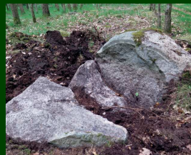
Post 3: Rillestenen