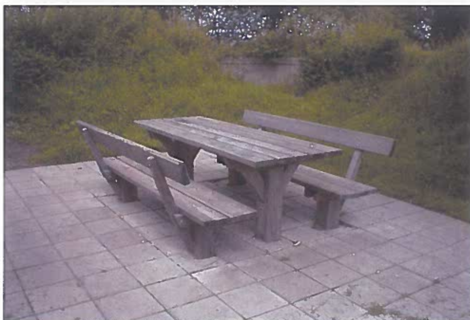
Figur 5 Denne type anvendes alene eller som del af borde- bænkearrangement