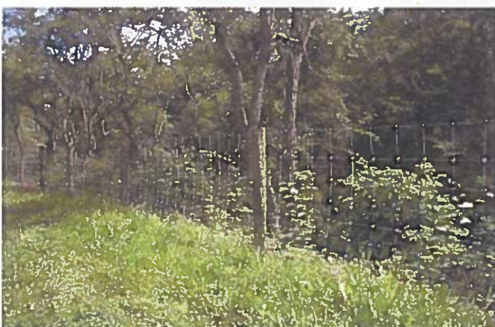
Figur 9: Afskærmning. Dyrehegn som kan anvendes til indhegning af græssende dyr, eller hvor det er nødvendigt i forhold til sikkerhed. Legepladsen ved Mørkhøjvej afskærms med trådhegn mod voldgraven.