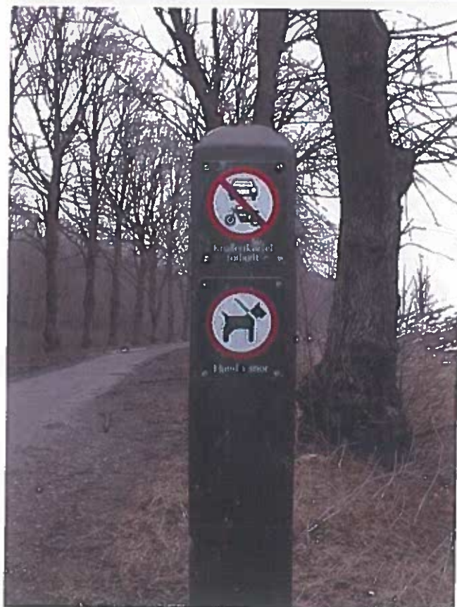
Figur 2 Skilteprogrammets pæl til opstilling ved indgangsveje til Vestvolden.