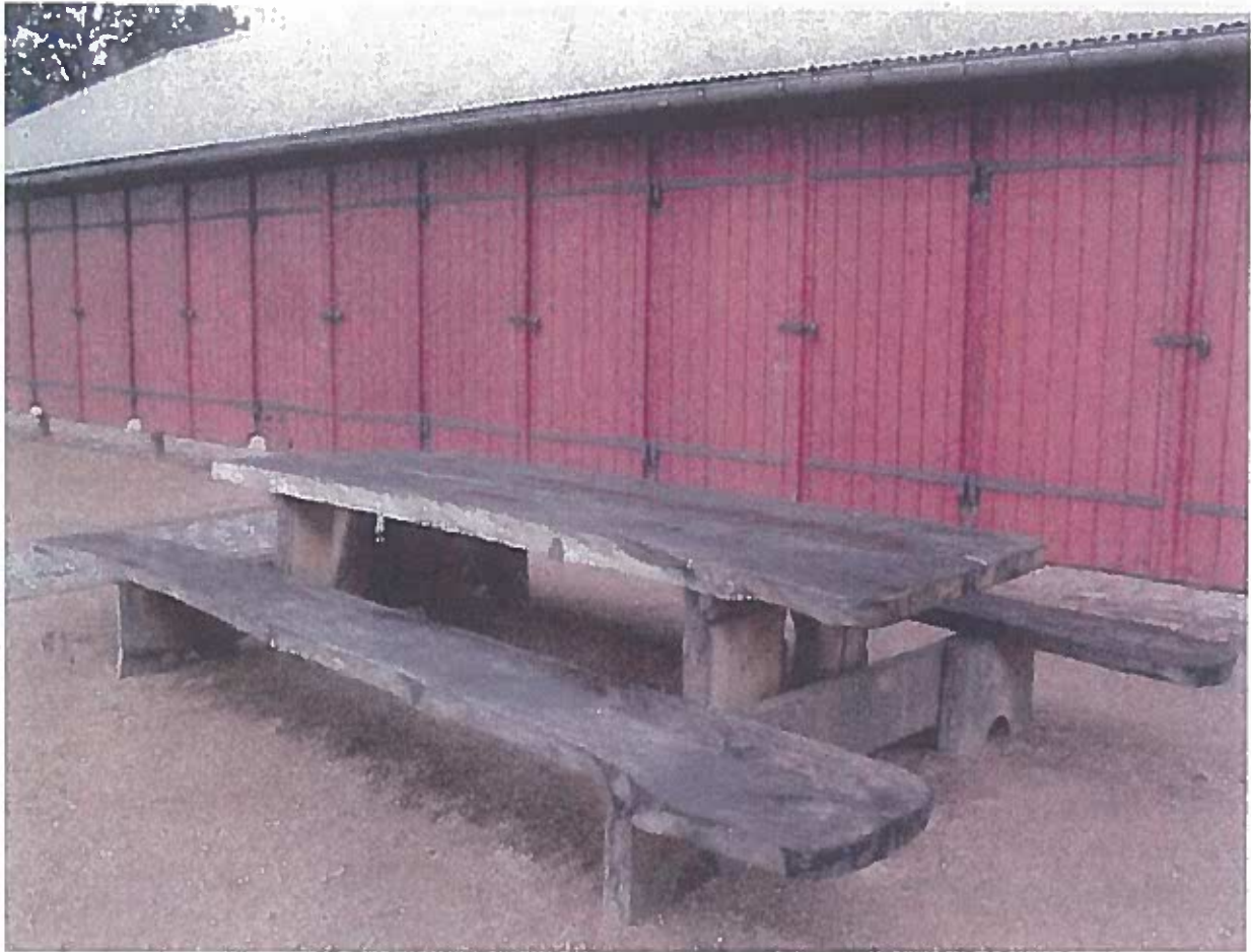
Figur 6 Alternativt borde/bænkesæt. Fremstillet af døde elmetræer. Det er vigtigt, at arrangementer med faste bænke udformes, så en korrestol kan placeres for begge bordender.

På særlige steder kan der udføres borde / bænke af det fældede træ på volden. Det er dog vigtigt, at det udformes enkelt, så det passer ind i omgivelserne.