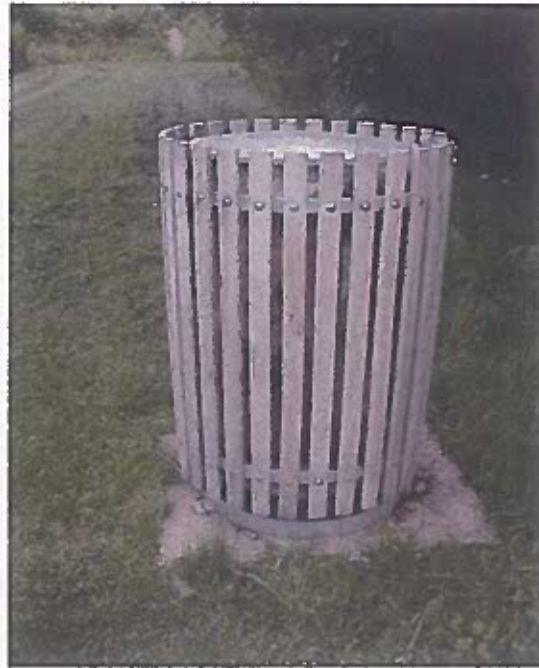
Figur 7: Affaldsstativ af metal med kommunens logo. Stativet isættes plasticpose (t.v.) eller i oliebehandlet teaktræ (t.h.). Trækappen skjuler en almindelig skraldespand.