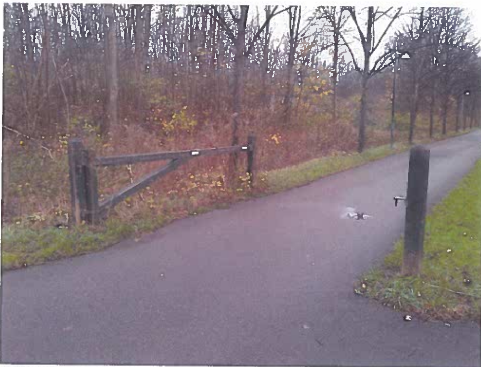
Figur 1. Bom og stole ved indgang til Vestvolden.

Detaljer om skilteprogrammets konstruktion og standardpiktogrammerne kan ses på 8. Eksemplerne er hentet fra Naturstyrelsens Skiltehåndbog 1996.