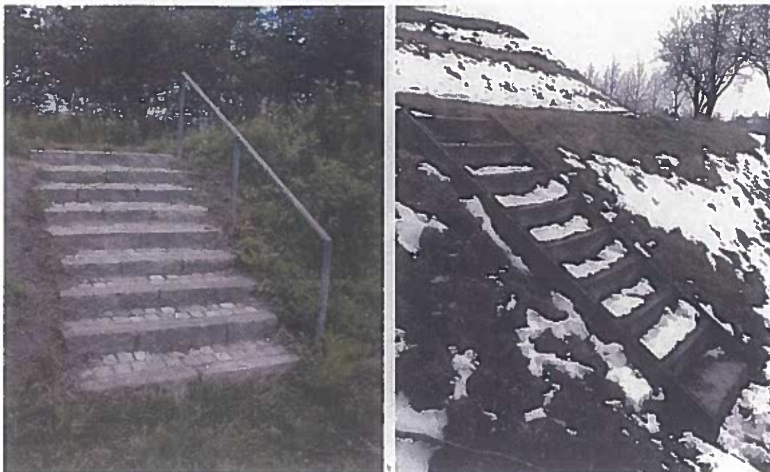
Figur 8: Trappe sat af kant- og chausseesten (t.v.) og vangetrappe af træ (t.h)