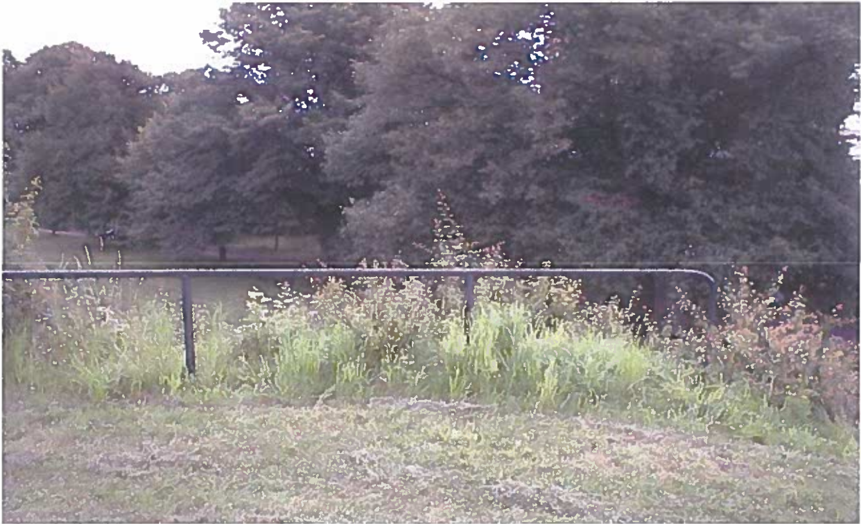
Figur 10: Afskærmende rækværk ved bygninger, hvor der er fare for styrt.