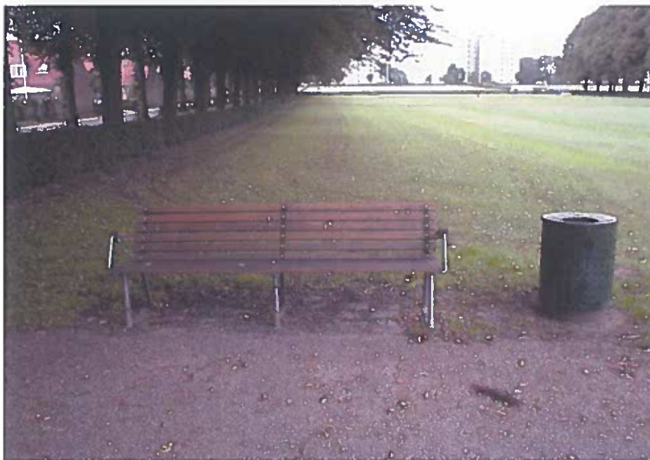
Figur 4 Fritstående bæk. Bænken er boltet fast på fliser. Flere kommuner har erfaring for, at bænken er robust og derfor ikke kræver megen vedligeholdelse.

Der er lagt vægt på at vælge en enkelt robust bæk, der kan boltes fast i fliser, således at bænken ikke skal funderes i fortidsmindet. Typen, der er vist, svarer til Århusbænken eller NH bæk og kan fås som bæk med og uden armlæn samt som borde/ bænkesæt. Materiale galvaniseret stål og træ.